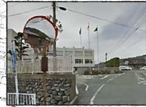
③輝翔館中等教育学校