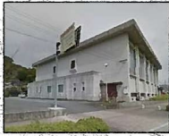
②黒木体育センター