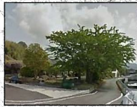
⑤豊岡コミュニティセンター