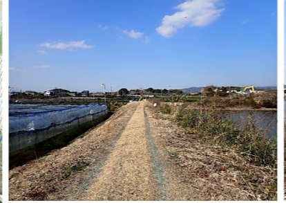
尾田上ため池 堤体状況