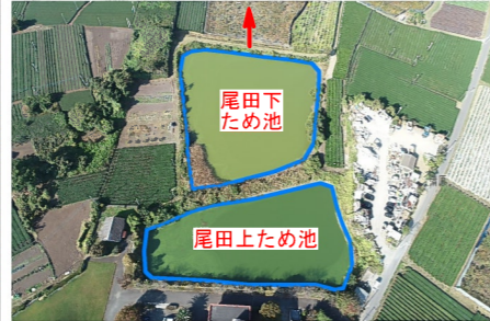
尾田下ため池 堤体状況