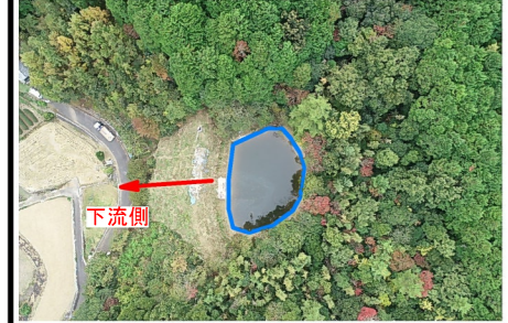
樋ノ口ため池 堤体状況