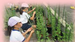
忠見小「忠見の菊、昔・今・そして未来」