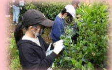
川崎小「八女茶の秘密を探ろう」