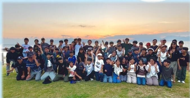
▲昨年度キャンプの様子