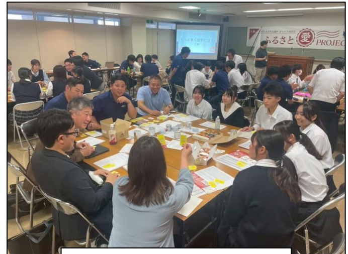
全体キックオフミーティング