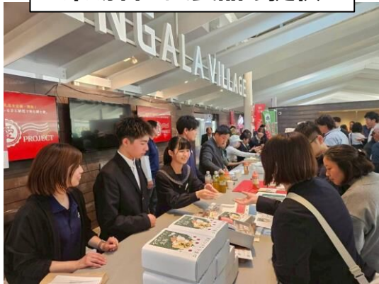
来場者へ試食品の提供