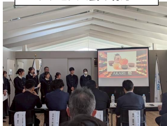
プレゼン大会の様子