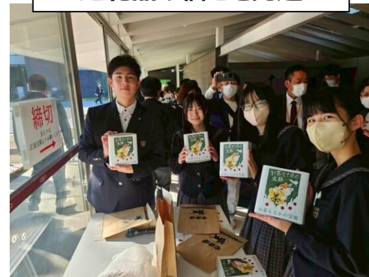
返礼品の梱包と発送