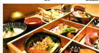
季節・ろくぼやま