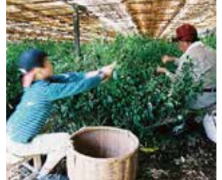
しずく茶は茶の文化館でどうぞ