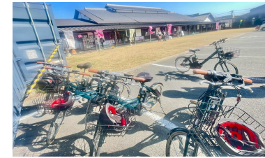
市の電動自転車を活用