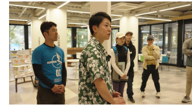
町歩きでダニルミュージアムの説明を受ける