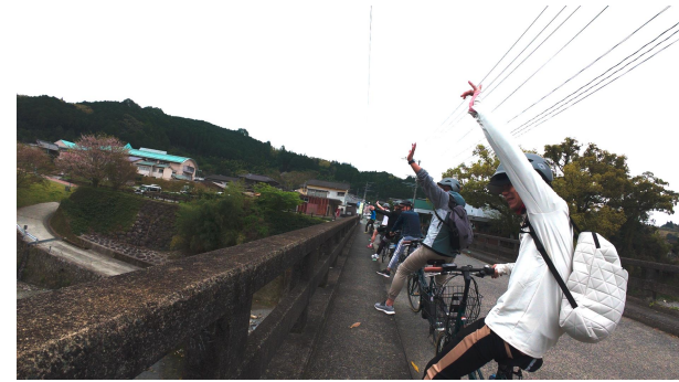
石橋の上を自転車で巡る