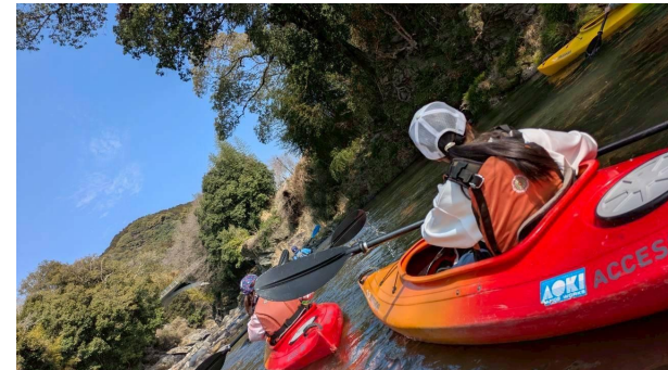
石橋を下からカヌーで見上げる