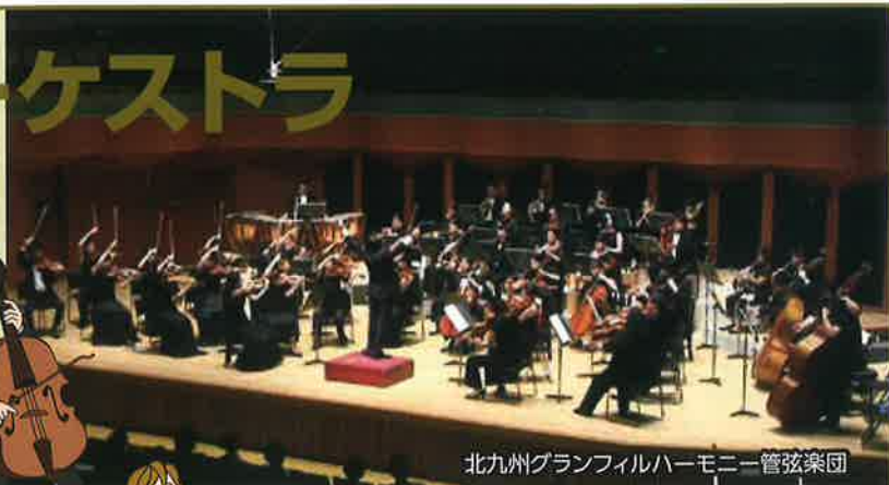
北九州グランフィルハーモニー管弦楽団

■お問い合わせ/サザンクス筑後 TEL:0942-54-1200/JAPAN LIVE YELL project in ぶくおか実行委員会 TEL:092-739-2318