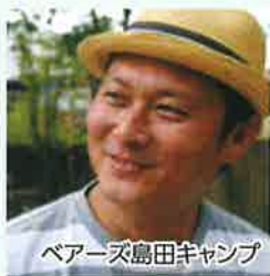
ベアーズ島田キャンプ