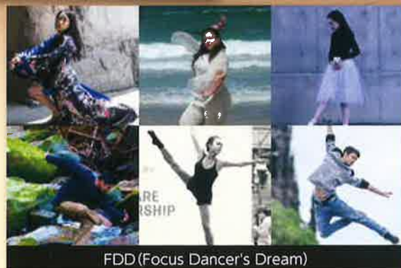
FDD(Focus Dancer's Dream)

■お問い合わせ/JAPAN LIVE YELL project in ぶくおか実行委員会 TEL.092-739-2318