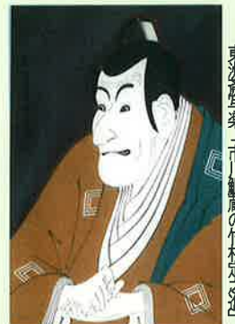
東洲斎写楽「市川鯉殿の竹村定之進」