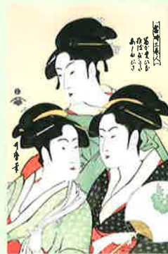
喜多川歌麿「当時美人図」