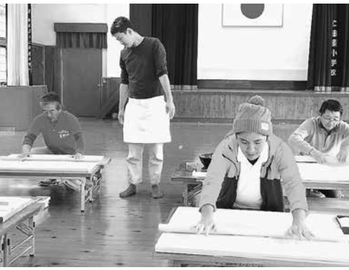
NPO 法人がんばりよるよ星野村の蕎麦打ち体験 (耕作放棄地を利用した蕎麦づくり)