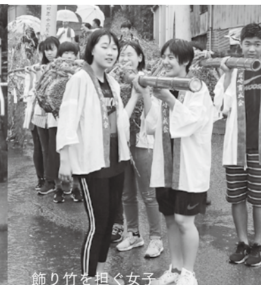
飾り竹を担ぐ女子