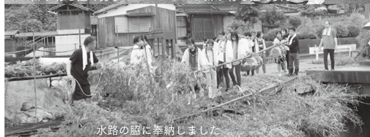
水路の脇に奉納しました