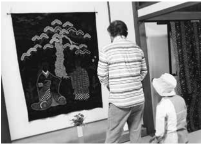
明治末期に制作された『高砂の翁媪』

横町町家交流館で7月12日(金)から15日(祝)まで、「重要無形文化財久留米絨作品展」(公財・久留米絨技術保存会等主催)が開催されました。会場には重要無形文化財技術保持者会員の作品と、明治から昭和にかけての久留米絨の逸品が約50点展示されました。久留米絨の最高傑作とされる『高砂の翁媪』を間近で観て、「このような絨は初めてみました。芸術ですね」と感嘆の声が上がっていました。