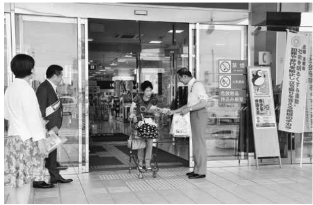
ゆめタウン八女で行われた街頭啓発

7月1日(月)と5日(金)に社会を明るくする運動街頭啓発を市内9か所で行いました。八女保護区保護司会八女支部をはじめ、更生保護女性会、八女警察署などの参加により開催されました。この運動によりたくさんの方に、犯罪のない明るい社会を築いていく重要性や更生の手助けの大切さを訴えることができました。 インターネットの普及等により、犯罪を取り巻く情勢は大きく変化してきています。犯罪や非行のない安全で安心な地域社会を築くためには、地域すべての人がそれぞれの立場で理解し関わりをもっていくことが大切です。この取り組みが、一人一人の意識を変えるきっかけになり、広がっていくことを願います。これからも地域の皆さまのご理解、ご協力をお願いします。