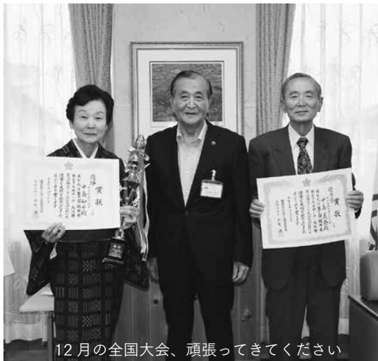
12月の全国大会、頑張ってきてください

人は、「現在病気で苦しんでいる人たちの励みになれば」との思いで日々活動に取り組んでいます。