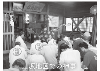
三坂地区での神事