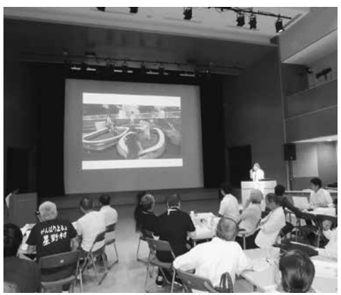
参加者はカフェの雰囲気の中で自由にまちづくりについて意見を出し合いました

市民との協働によるまちづくり提案事業成果報告会・意見交換会「協働カフェ」が6月22日(土)、おこなす八女はちひめホールで開催され、約50人が参加しました。平成30年度にまちづくりに関する事業の提案を採択された13団体は、清水町商店街の活性化を目的とした夏祭りの開催や、全国でも貴重な皮白竹を利用した工芸品の創作ワークショップの実施など、地域の魅力を生かしたまちづくり活動の成果を報告しました。その後は、参加者同士がそれぞれの活動やまちづくりについて自由に意見交換し、互いの交流を深めました。参加者は、用意されたジュースやケーキを飲食しながら、まちづくりのアイデアや課題について活発に意見を話し合っていました。