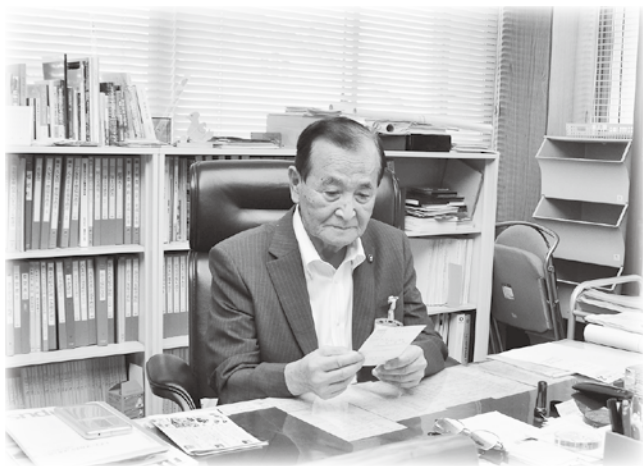
三田村市長が全てのはがきに目を通しています。