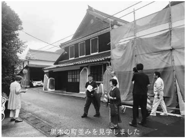
黒木の町並みを見学しました

国選定の黒木伝統的建造物群保存地区で6月30日(日)黒木地区町並み保存協議会による修理事業見学会が開催され、地区内外の市民が参加しました。平成30年度に文化庁の補助事業により修理された9軒のうち、黒い漆喰塗りに復原され大きな青石張りがみごとに明治15(1882)年建築の居蔵造りの町家など、7軒を見学しました。