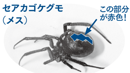
【セアカゴケグモの特徴】 メスの体長は約0.7～1cm。全体が光沢のある黒色で、腹部の背面と腹面に赤色の模様あり。毒をもっているのはメスだけ。

▼かまれた場合は ①かまれた傷口を温水や石けん水でやさしく洗い流し、病院を受診してください。 ②受診の際はより適切な治療のため、殺虫剤等で駆除したクモをできるだけご持参ください。