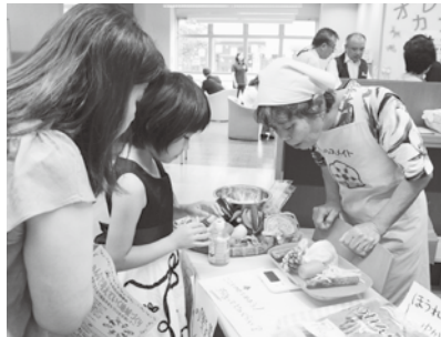
【食の健康コーナー】「1日に必要な野菜約350グラムってどのくらいかな？」自分で計って確認しました。