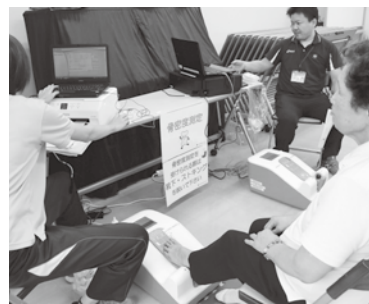
【骨密度測定】骨密度は骨の強度を表す指標の一つです。気になる測定結果はどうだったでしょうか。