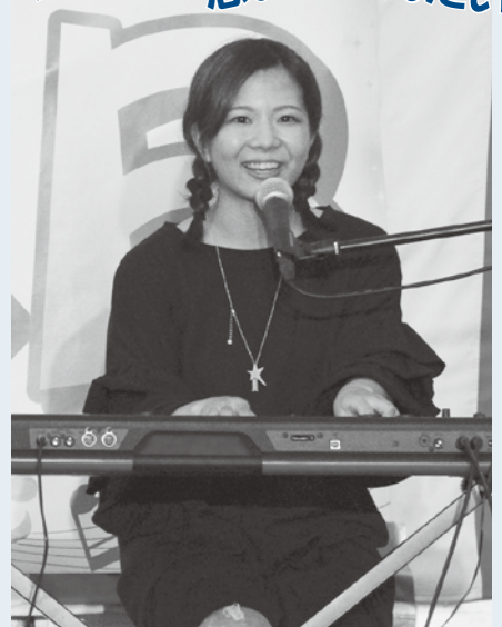
八女市上陽町出身。中学時代は箏部、高校時代は唯一の心残りであった空手をやり遂げ、高校卒業後本格的に音楽の道へ。代表曲シンデレラは、「最初は思い通りにいかなくとも人生を切り開いていくのは自分」とメッセージを伝えている。FM八女には第1木曜日に出演。