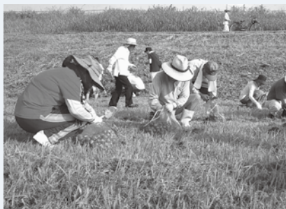
平成29年度地域づくり提案事業「矢部川河川敷および遊歩道沿いの景観づくり事業」(三河校区まちづくり協議会)

①地域振興計画の更新 ②共同生活の維持および住環境の整備、景観等の保全 ③地域振興活動、地域活性化活動 ④住みよい地域づくり活動 ⑤人材育