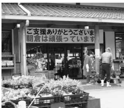
たくさんの品物が並び、復興に向けて賑わいを見せる直売所

朝倉市災害ボランティアセンターでは、平成29年11月現在、延べ四万五千人を超すご協力により被災者支援が行われました。