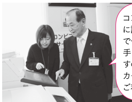
市長も自動交付機で住民票を取得しました

コンビニなどで簡単に証明書が取れるので便利ですね。交付手数料も安くなりますので、マイナンバーカードを作ってぜひご利用ください