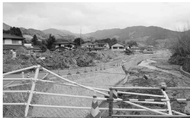
いたるところで復旧工事が進められています (1月現在)

現在は、家屋への支援依頼が減ってきたため、事前登録したボランティアの協力をいただきながら活動を行っている状況です。しかしいたるところで道路や河川の復旧工事が行われていますし、農家の営農再開には継続的な支援が必要です。各地で様々な団体が復興に向けて活動を行っていますので、息の長いご支援をよろしく願います。