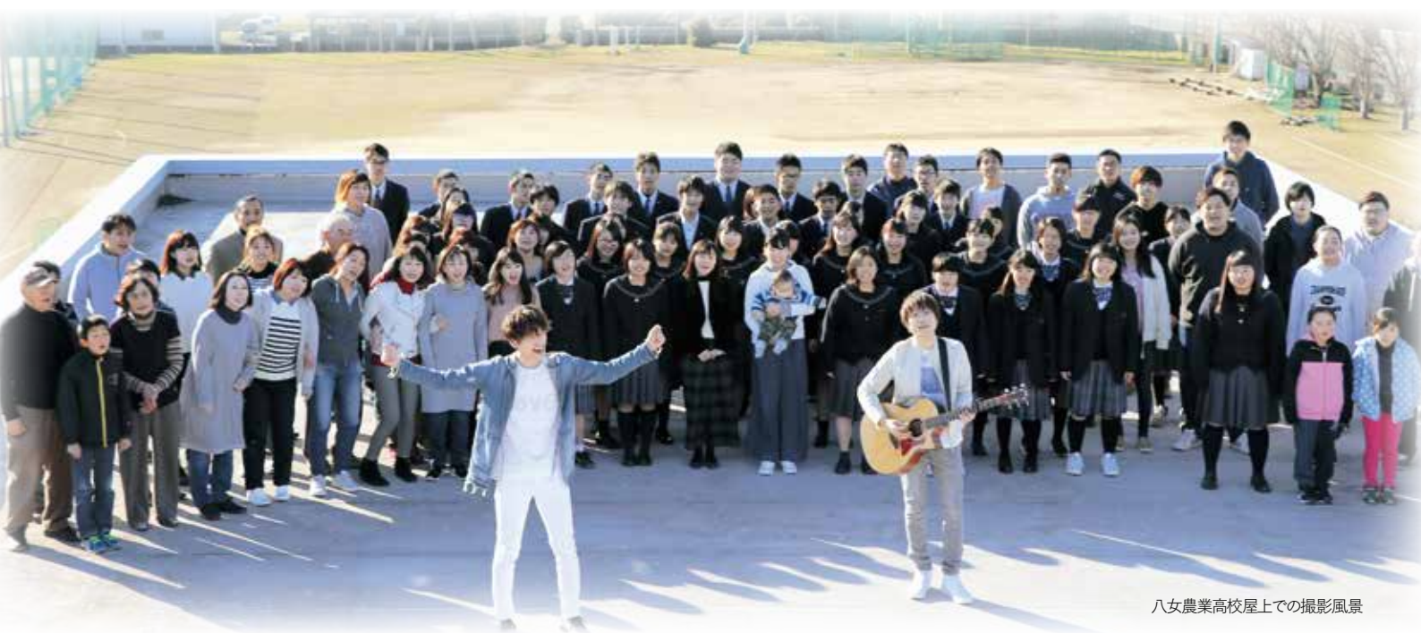
八女農業高校屋上での撮影風景