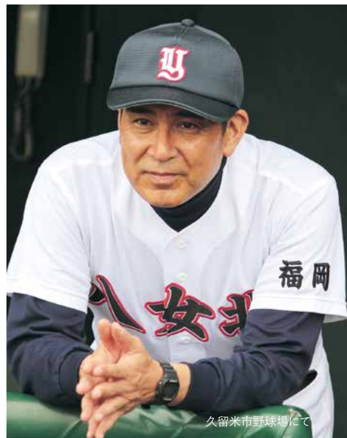
久留米市野球場にて

八女市については、大体の位置と、お茶が特産品で有名であることぐらいは知っていたんですが、実は撮影期間