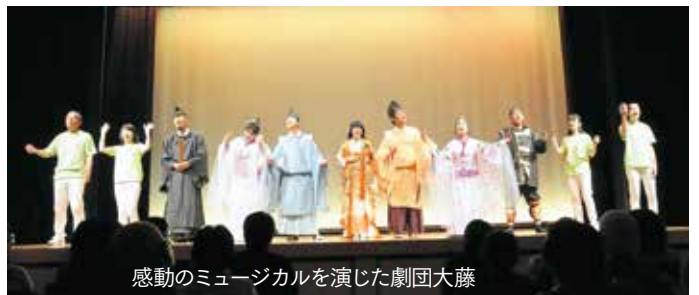
感動のミュージカルを演じた劇団大藤

また、八女市の市民劇団・劇団大藤が、ミュージカル「藤の記憶」ダイジェスト版」を上演しました。「藤の記憶」は、八女市でも上演された、後醍醐天皇の孫であり、幼い頃に吉野から九州へ下向された後征西將軍良成親王と、その妃である姫御前との美しくもはかない愛の物語です。会場には、抽選で選ばれた300人が見つめる中で渾身の演技を披露し、客席からは涙を流す姿が多く見られました。上演後は、中園市長職務代理者から吉野町へ友好交流の証として国指定天然記念