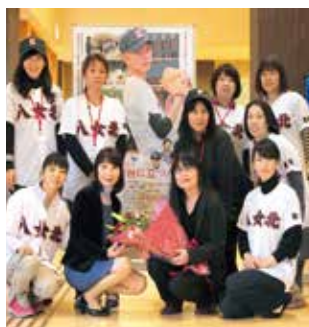
原作者 竹島 由美子さん

最初は半信半疑だったものの、平成15年から10年近く続いたあのかけがえのない時間が映画となつて残ることは大きな喜びでした。全く異質な学校生活を送ってきたからこそ、本気でぶつかり合うしかなかった野球部員と演劇部員たち。その両者を包み込むようにして指導し続けた演劇部の先輩たち。世代を超えてつながった青年たちが見せてくれたのは、奇跡のようなドラマの数々でした。対立しながらも互いを認めていく高校生たちの青春を真摯に描き出してくださった製作スタッフの方々には心から感謝しています。 東京や福岡の試写会に参加した方々からは、「製作に関わった地元の人たちが画面の背景に感じられて、本編と製作プロセスという2本のドラマが同時進行しているような美しい映画でした。それにしても八女って本当に素敵なおとこですな」と、とてもうれしい感想をいただきました。映画製作に関わった全ての方々、本当にありがとうございました。