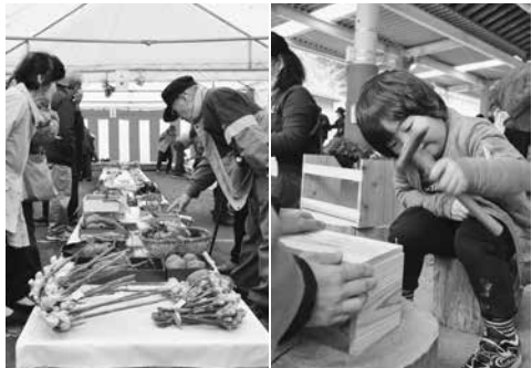
矢部の大地で育った見事な農産物の数々