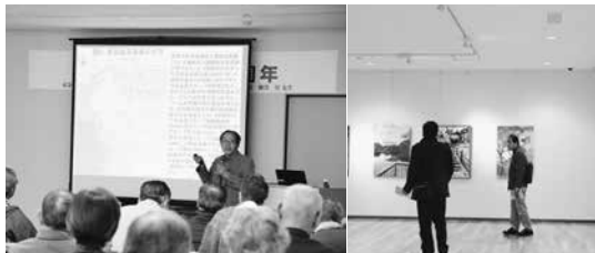
多くの考古学ファンが集まった講演会