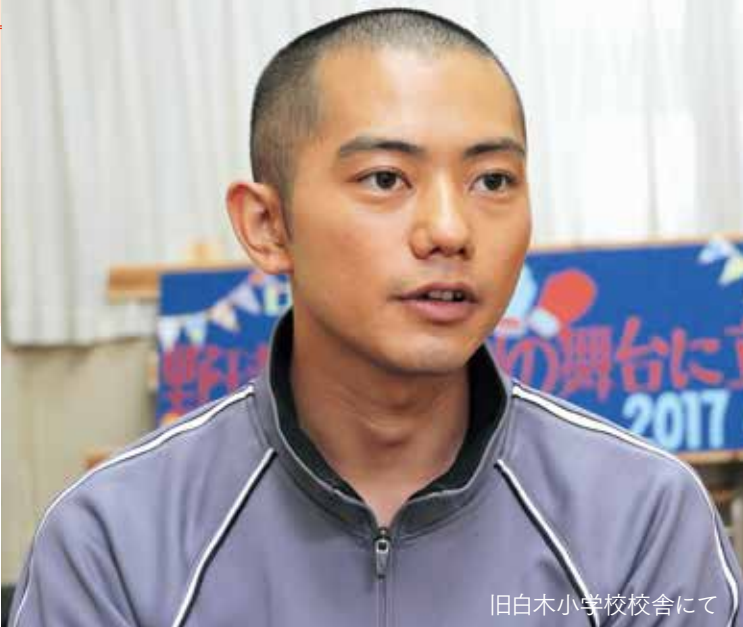
旧白木小学校校舎にて

撮影には、本当に市民の皆さんが協力的で、そのおかげで無事にクラクインアップできました。皆さんの協力がなかつたら絶対できなかった映画なので心から感謝しています。その気持ちを意気に感じ、私自身もいい映画に仕上げたいという強い思いで撮影に臨みました。とてもいい映画になったと思うのでぜひたくさんの方々に見に来ていただきたいと思えます。