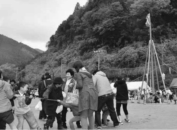
みんなで声を合わせ、力を合わせ石づきに挑戦

は、矢部の小中学生58人が練習してきた八女津媛神社浮立をはじめ、村で代々うたい継がれてきた公卿唄・木挽き唄・山師音頭などの民謡、家を新築する際に行われてきた郷土芸能「石づき」、飯干太鼓等が披露されました。そのほか、矢部産材を使った木工体験、毎年大変な盛り上がりを見せるコケッコ競鶏レース、豪華賞品が当たる恒例の「宝探し」等々、矢部まつりならではの催しが盛りだくさん。山里に実りの秋を祝う歓声がこだました2日間となりました。