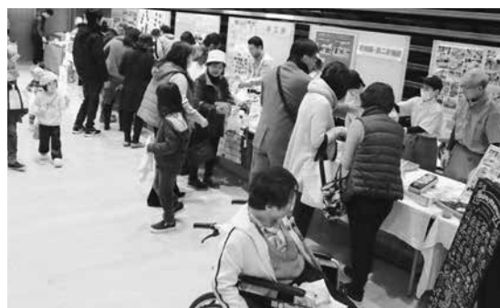
スマイルフェスタでの障がい者支援施設をはじめとする各種団体による展示、体験、販売コーナー

私は、なんだか悲しくなっていたやいな気持ち、不安な気持ちになりました。それと同時に、あの時のことが思い出されてきました。あの時、私が悪口やうわさ話を信じて、友だちと話さなくなったことで、友だちは、「みんな、何で話さないんだろう」と、とてもつらい思いをしていたのではないかと思います。それは、しばらく続いたので、ずいぶん苦しんでいたと思います。私は、自分がこんな気持ちになっ