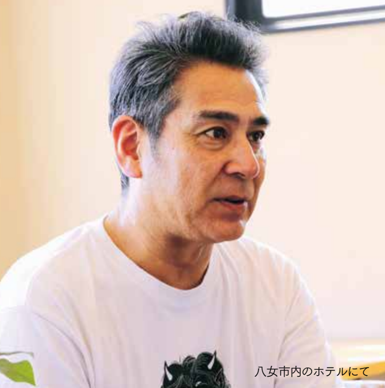
八女市内のホテルにて

支援する会スタッフの方々はじめとして、八女市の皆さんの本場に大きな力をいただいて、この作品のほとんどの部分ができたと思います。できあがった作品の場面の中に、市民の皆さんの気持ち、心みたくなものが必ず映っていると思いますので、ぜひ完成を楽しみにして欲しいですね。また、映画が完成した後もこの作品の応援をよろしくお願いたします。