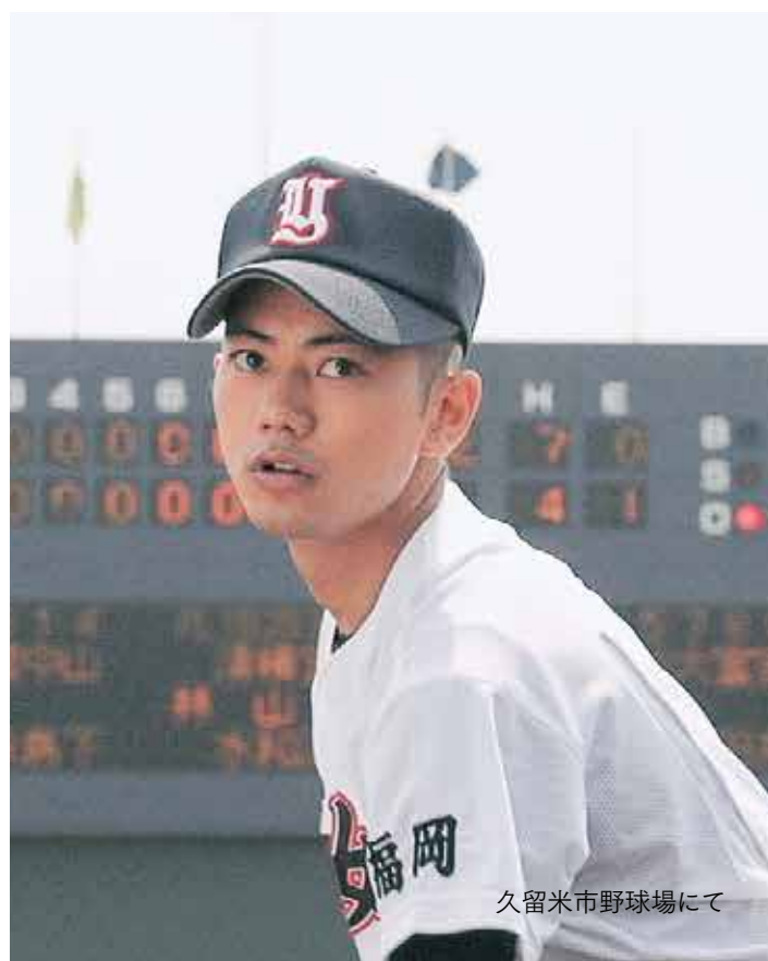
久留米市野球場にて

私は新潟県出身で、街の雰囲気は私の故郷と似ているところがありますが、大茶園など八女市ならではの風景、姿を自分で見て、そこで撮影をし、それがスクリーンに映るというのは本当にうれしいことです。今回、八女市民をはじめとする多くの方々に協力していただき、温かい気持ちを感じました。八女農業高校でロケをした時に、