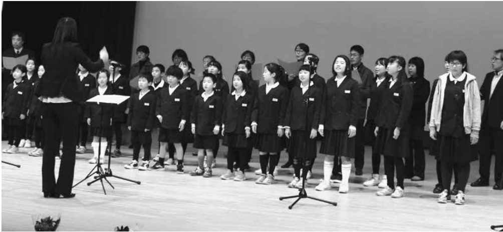
スマイルフェスタで合唱を披露する八幡小学校 みんなで歌おう教室の皆さん