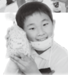
(下) ポン菓子はイチゴ、お茶、プレーンの3味を作りました