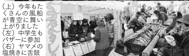
(上)今年も風船が空を舞った。今年も空を舞った。今年も空を舞った。(左)バザーで焼き。(右)バザーで焼き。

11月19日(日)黒木町笠原地区の旧笠原小学校で、第32回笠原まつり「だっでん祭」が行われました。この祭りは約30年前に地元青年団OBが人口流出に歯止めをかける地域おこしを目的に始めたもので、「誰でも(だっでん)来てください」との思いで名付けられ、現在に至るまで「地域のふれあい・都市との交流」などをテーマに毎年実施されています。会場には、山太郎ガニやヤマメ、棚田米、地元産野菜などが並ぶバザーをはじめ、黒木小学校人形浄瑠璃クラブの公演を皮切りに、和太鼓やダンスパフォーマンスなどのステージイベントが会場を沸かせ、秋晴れの里山にぎわいの声が響いていました。