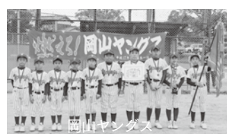
11月26日/三河小グラウンドほか