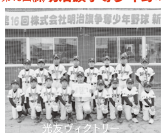
光友ヴィクトリー

優勝=松原ライオンズ(筑後市)、2位=光友ヴィクトリー(八女市)、3位=広川イーグルス(広川町)、山鹿少年野球クラブ(山鹿市)