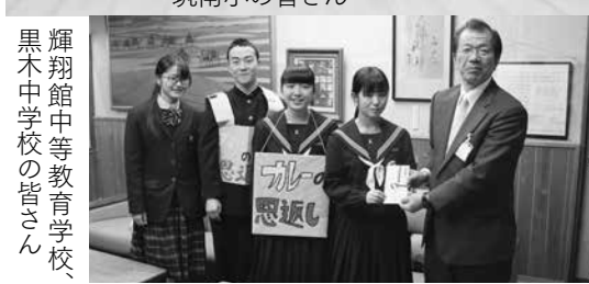
輝翔館中等教育学校、黒木中学校の皆さん