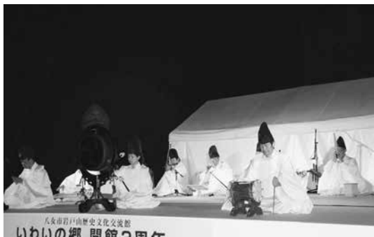
八女市岩戸山歴史文化交流館 いわいの郷開館2周年 会場全体が幻想的な雰囲気包まれた雅楽の演奏