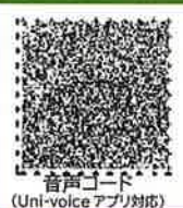
音声コード (Uni-voiceアプリ対応)