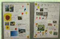
昨年度のパネル展の様子