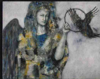
《くぐり輪》2014年 作家蔵