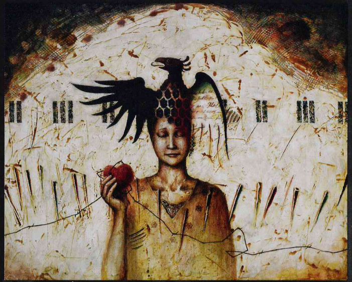
《囚われの想い》2016年 作家蔵