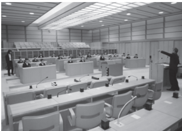
議場で、説明を受ける筑南小学校6年生のみなさん

答 1番が副議長、26番が議長、ほかは、当選回数のない人から若い番号順になります。