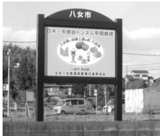
トンネル整備の推進看板

問 豪雨の際、吉田地区において道路や民家の冠水が頻繁に起こっている。どのような対策を考えているのか。