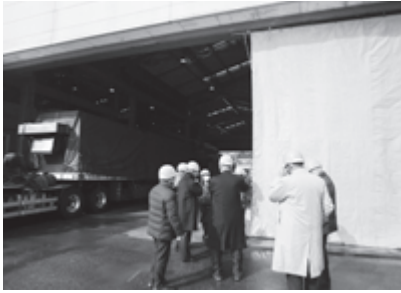
真庭市での研修の様子

他に岡山県内企業者を訪問、「株式会社岡山製紙」「平林金属株式会社」に八女市の木材支援金の協