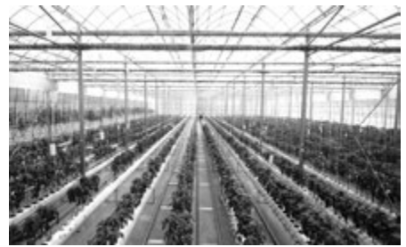
パプリカ水耕栽培