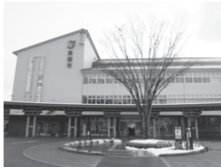
真庭市役所本庁舎