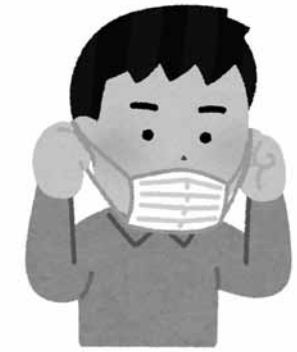
密閉・密集・密接は避けて

議員 相談窓口や専用ダイヤルを設置し、市民に分かりやすい対応をすべきでは。 課長 県が構築する医療体制に際して対応したい。 議員 学校の休校で特に保護者が困惑しているが。 教育長 保護者の一番の不安は学習の保障であり、未履修分は小中学校等で連絡調整し新学年で行う。 観光行政について 議員 第四次総合計画の観光客目標達成は難しいと思うが、ビッグデータ等を活用した取り組みをすべきでは。 副市長 情報収集が容易になってきているので、今後は活用していく。