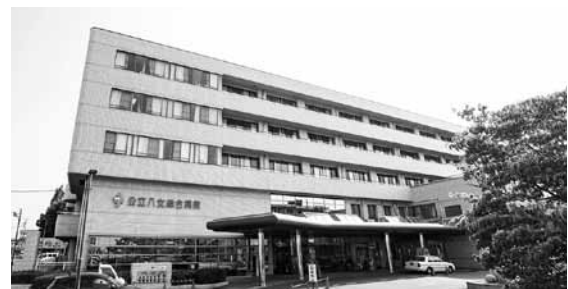
公立八女総合病院外観

議員 市長は、任命はするが財政と運営は公立病院の企業長に全責任があるように言われる。以前より文書を持って過疎債の運用や建築費等、市財政に係るところまで企業長が言及されているが、それも140億円等莫大な金額である。任命権者である市長は自分に関係がないがごとの発言は無責任ではないか。その