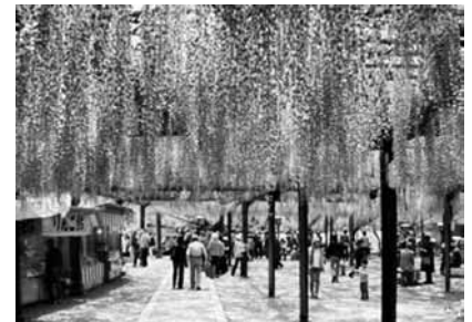
大藤まつりの観光客の風景

議員 観光事業推進にあたり、観光案内所のスタッフは何人で、その人数で足りているか。 課長 案内所長1名、旅行事業1名、インバウンド対応1名、窓口案内業務2名、計5名あり、観光振興課と協力しながら推進している。 議員 インバウンドも含む観光客の対応はどのように行われているか。 市長 茶のくに八女・奥八女を観光コンセプトに八女のおもてなしの心で対応している、また英語表記のホームページやパンフレットの設置などを行っている。 議員 日本版DMO(旅