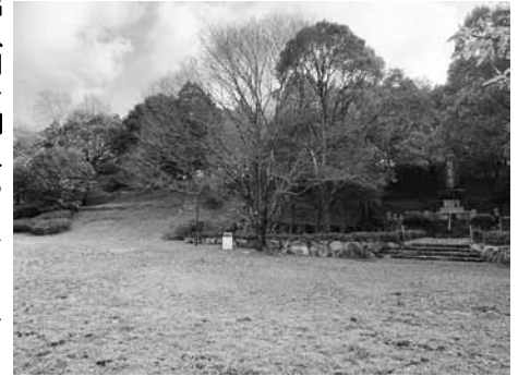
自然あふれる飛形公園

議員 流出人口を抑える手だては。 副市長 新規就農や起業・創業による就業の場の拡大を図る。また、出会いから結婚・出産・子育て・高齢者支援まで切れ目のない支援により、安定した定住化を進めていく。 議員 八女市には子供が遊べる広場・公園が少ないため、市外に遊びに行かれています。今後、飛形公園など、人々が楽しめる工夫をお願いしたいが、