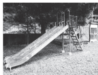
旧上辺春小学校すべり台