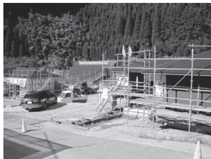
矢部地区に建設中の山村滞在施設