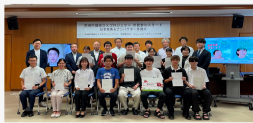
令和4年8月 8月5日より市民との実証実験スタート

若年層を中心としたアンバサダーが SNS 等で議会のことを発信したい意欲を持っている一方で、現状は議場内での撮影が禁止されている。この点について、次の3月議会から、アンバサダーによる議場内撮影をマスコミと同様に可能にしていく方向で話が進んでいるとの説明があり、議会の透明性を高めながら、市民発信にもつなげていこうとする動きとして引き続き注目したい。