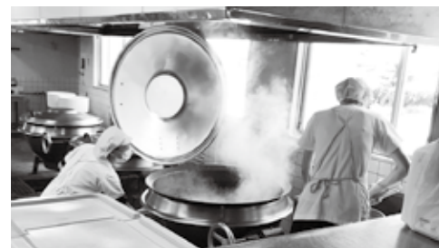
食育も教育の一環である