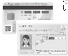
総務省「マイナンバーカードサンプル」