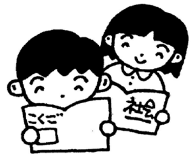
学習する子どもたち