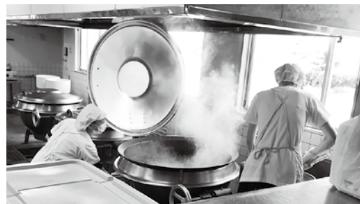
おいしい給食をありがとう