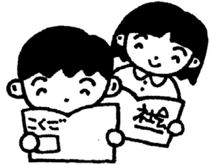
学習する子どもたち

議員 忠見小学校と川崎小学校では、統合に対して保護者や地域などの認識の差が大きい。これは、忠見小学校で統合について説明会が開かれていないことが大き