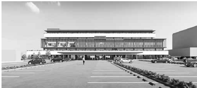
八女市新庁舎 北側正面パース

立地適正化計画に期待! 議員 計画策定までの今後のスケジュールは。 市長 10月以降に市民説明会及びパブリックコメントを実施し、令和4年3月までに策定する。 議員 立地適正化計画は、都市計画区域に限定されるため、区域外の方々に説明する必要があるが、