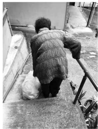
住み慣れた地域で暮らす

課長 地域の隅々までそのサービスが行き届いていない状況である。 議員 住まいの確保・買物・交通手段等々多くの課題の改善のためには、保健師の訪問による実態把握とその結果を政策実現につなげてほしいが。 支所長 生の声を聴くことで色々なサービスの提供・関係機関との連携は密にできている。