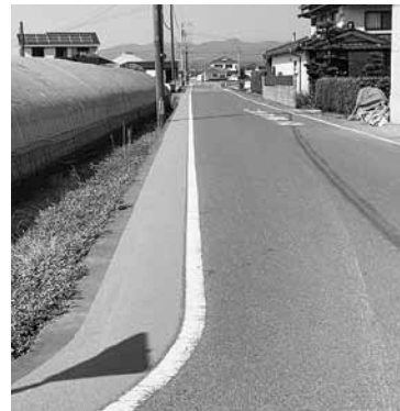
グリーンベルトが設置された通学路ドライバーに通学路を視覚的に認識させます

八女市の農業について 議員 親元就農を含む新規営農者の確保と育成について八女市の考えは。 課長 イチゴ、トマトは就業支援センターで研修を行っている。それ以外の品目については、生産農家での実践的な研修が行える受入れ農家のピックアップまで終わっている。 議員 農業被害を伴う災害が毎年のように起こっている。収穫時期を迎えた園地へ行けないのは農業者にとって死活問題である。災害が予想される前に迂回路の安全点検や確保が必要ではないか。 市長 迂回路問題は、農業政策でも大きな課題であり、十分検討し進めていく。 公共施設のあり方について 議員 公共施設に要する年間の維持管理費は。 課長 平成元年以降は年間17億8千万円程度で推移している。 議員 公共施設の統合や廃止をどのように進めていくのか。 課長 公共施設等総合管理計画の目標達成に向け、施設の集約化や複合化、地域の特性を踏まえて全庁横断的に協議、検討をして適正な配置に取り組んでいきたい。