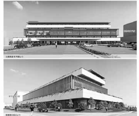
八女市役所新庁舎 外観イメージパース

議員 財政的に有効な財源として起債を活用することのだが、どのよう に有効なのか。 課長 事業費に起債を充当することで、交付税措置がされる。また償還期間が起債種別に応じて設定されており、平準化できることで、財政負担を軽減できる。 まち・ひと・しごと創生総合戦略について 議員 令和2年度を含めた第1期総合戦略をどのように分析しているか。 課長 産業育成の分野や若者の就業支援については、厳しい状況である。移住・定住、子育て支援 議員 観光振興の分野では一定の効果が現れている。 議員 転入や転出時に、その理由などの調査は行われているか。 課長 現在、アンケート調査は行っていない。転出・入される方々の意見を聞くことは非常に大事なことで、導入に向け最終的な協議を行っている。 議員 八女市で空き家をリフォームして、すぐに貸し出せる物件を取得し、転入希望者に案内できる仕組みを構築できないか。 市長 空き家の土地、建物を購入して、外部から住んでいただくのは、難しいのではないかと思う。