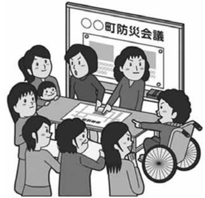
災害時の個別支援計画策定が急務

議員 市民の皆様が将来に及ぼす影響を考えた時、財政運営をどう乗り越えていけるのか。 部長 経済情勢が大変厳しい時、市民の方々の生活が厳しい時には、それを支える意味で財政的な支出が必要である。 議員 緊急小口資金・総合支援資金申請者の増加や所得減による国民健康保険税や介護保険料の減免者の増加等々、生活困窮者が急増しており、できる限り歳出を減らす努力義務が必要では。 副市長 事業の見直しを含め予算編成をやる。