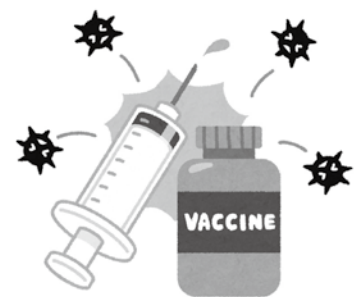
ワクチン接種が待たれる

議員 これでは月に1回にもならない。せめて、週1回はすべきと専門家の意見もある。国、県に増やす要求をすべきだ。