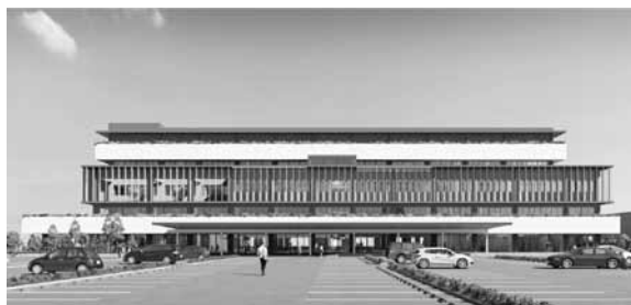
新庁舎外観イメージ