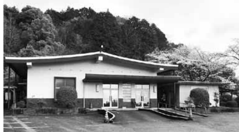
老朽化している斎場

答 住民説明は重要であると認識している。令和3年度の基本設計で敷地や地質の調査、造成や建物規模の検討を行い、住民説明に必要な情報を整理したいと考えている。実設計前には、住民の合意形成を図っていく。