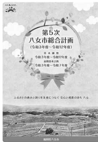
総合計画 地方自治体が策定する全ての計画の基本となり、まちづくりの最上位に位置づけられる計画