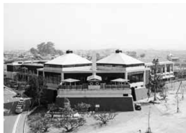
改修されるべんがら村

答 レストランはバイキング方式からオーダー方式に変更し、新棟のカフェでは八女の農産物を使ったドリンクやスイーツを中心とした提供を考えている。休館中にメニュー