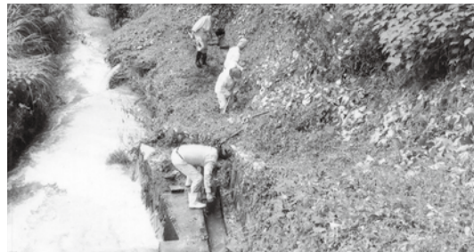
集落協定での水路整備作業