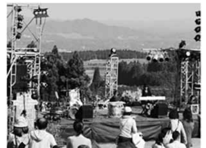
2019年のライブイベントの様子 早く通常の生活に戻りたいものです

市長 大変心配しているところである、今後の方針は、コロナウイルス感染症対策と経済活動を並行して進めて行く。問題のない事業は再開する。