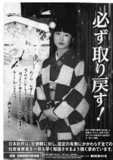
日本政府は、北朝鮮に対し、認定の有無にかかわらず全ての 拉致被害者を一刻も早く帰国させるよう強く求めています。 政府 拉致問題対策本部

議員 全ての学校でやっ ているのか。 課長 すべての学校には 至っていない。 議員 北朝鮮人権侵害問 題啓発週間はいつか。 課長 毎年12月10日から 16日の1週間となってい る。 庁舎問題、公立病院問題 について 議員 公立病院の建て替 え事業費約140億円は 過去全員協議会において 説明されたものであるが 市としての考えは。 市長 私には確かな企業 団からの考えとしては聞 いていない。 議員 自伐型林業におい て必要な機械、小型バッ クホウ、あるいは林内作 業車、チェーンソー、そ ういうものに対する補助 は今現在あるのか。 課長 一定の要件はある が、県の森林環境税を活 用した自伐用林業機械の 導入に対する支援がある。 市においても間伐、造 林等における20%補助等 をやっている。