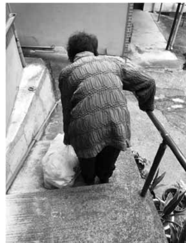
ゴミ出し支援は待ったなし

議員 乗合タクシーや路線バスでは利便性が悪く、運転免許証の返納も困難な方々への対応に、官と民とのプロジェクトを立ち上げてはどうか。