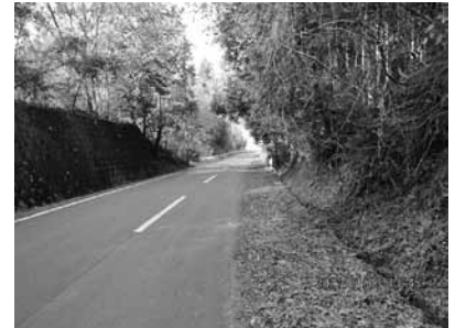
市道渡内鹿子生線（串毛地区内）

課長 国の農業次世代投資事業を活用しており、準備型と経営開始型に分類されていて共に交付額