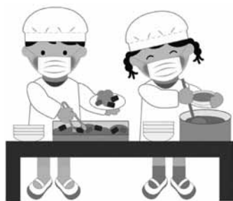
安全・安心な学校給食を