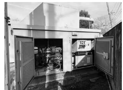
立花庁舎の非常用発電設備

議員 電気自動車の導入を考えてほしいが、 課長 停電になった時には使えない。 議員 電気自動車の導入を考えてほしいが、