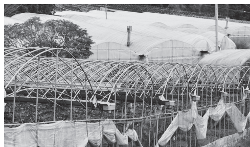
被害を受けたビニールハウス