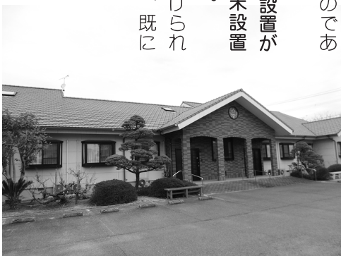
改修を予定しているグループホーム