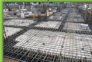
断熱材の上に1階床の鉄筋を組んでいます。

ここが、新庁舎の1階の床の高さなんだって。建てる前の駐車場だった時の高さに合わせて計画されているようだよ。おりなす側の角の透明パネルから中が覗けるので近くを通るときは確認してみてね。