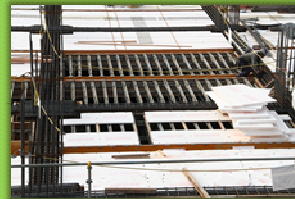
1階の床（梁と梁の間）の下に断熱材を敷き込みます。