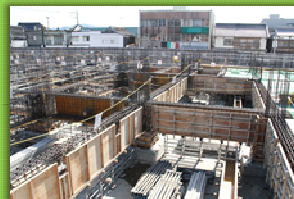
免震装置上の基礎同士を梁でつなぎます。