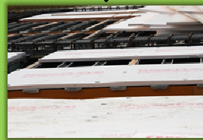
断熱材（ポリスチレンフォーム30mm・型枠兼用）敷き込み状況