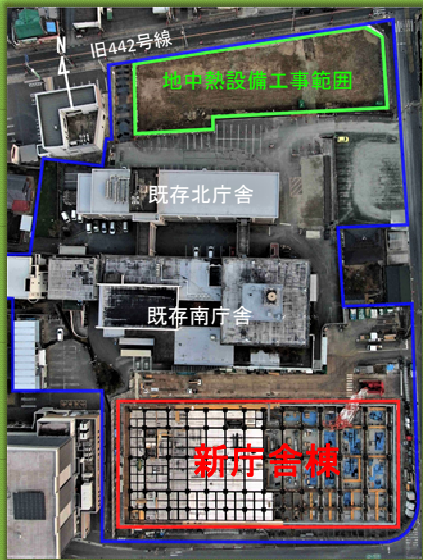
市役所敷地上空から（令和5年1月6日現在）