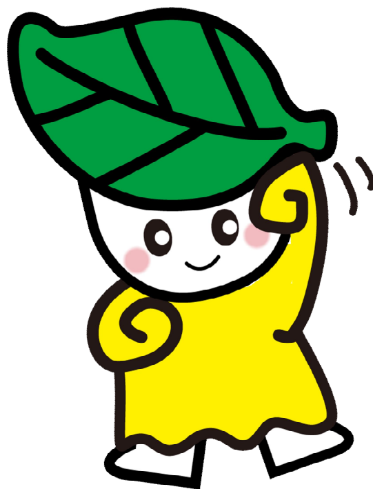
みどりちゃん(八女市公式キャラクター)