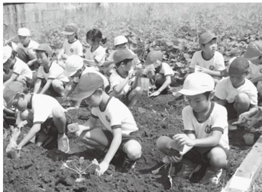
わくわく畑で苗を植える

学校の敷地内にある「わくわく畑」。総合的な学習の時間を使って、この畑で野菜を作り、採れた野菜で料理をしたり、低学年は家を持ち帰って料理してもらったりします。例えば、4年生では「大豆っていいな」をテーマに大豆を育て、採れた大豆できな粉や豆腐を作りました。その