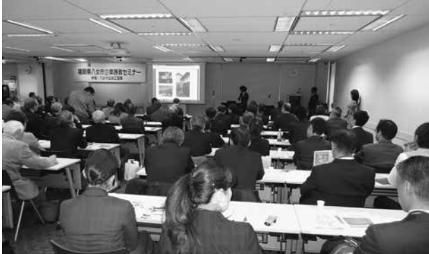
(上) 会場 セミナーの様子