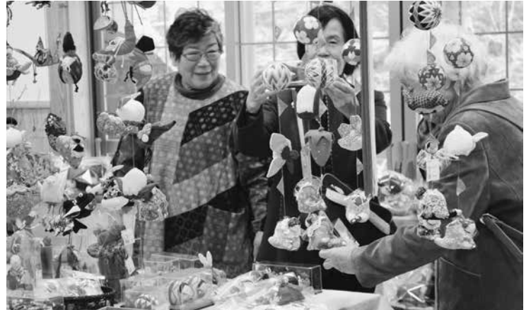
手作りさげもん和縁起物に見入る皆さん