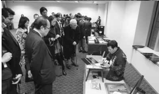
(下) 伝統工芸の 実演の様子