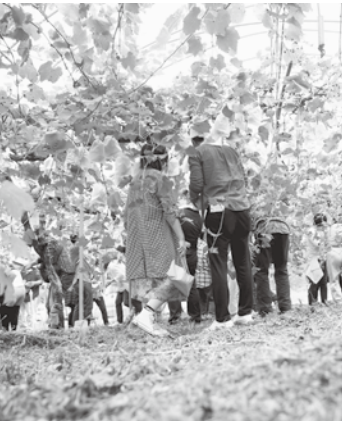
山の自然とふれあいながら男女の出会いの場を提供した「山婿」