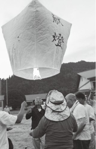
和紙の燈籠を夜空に浮かべた「大淵献燈祭」