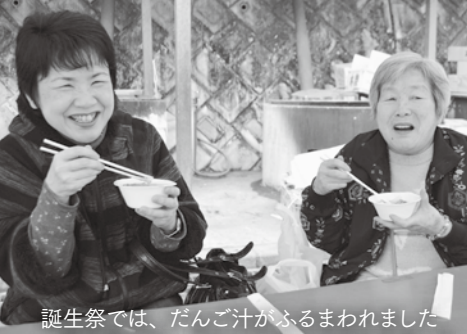
誕生祭では、だんご汁がふるまわれました