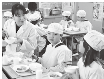
(給食の時間) 子どもの笑顔が活力に

私は毎日、子どもたちと一緒に教室で給食を食べることにしています。共に食べることで、子どもたちの様子を感じ取れます。そして、笑顔で食べる姿から元気をもらい、「おいしかったよ」「ありがとう」と言ってくれる度に、栄養教諭という仕事にやりがいを感じています。子どもたちには自分の健康は自分でつくれるようになってほしいと思っています。そのため、弁当の日を通して、自分で料理することのできるだけ多く経験させたいのです。同時に、挑戦することやできた時の達成感を味わって欲しいと思います。