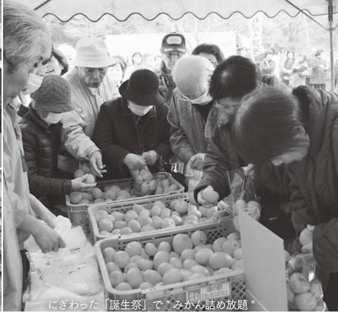
にぎわった「誕生祭」で「みかん詰め放題」

全国の道の駅の中から、道の駅「たちばな」が平成27年度重点『道の駅』に選定されました。これは、国土交通省が平成26年度から関係機関と連携して、地方創生の核となる特にすぐれた取り組みを選定し、重点的に応援しているものです。平成27年度は、地方創生に資する地産地消の促進および小さな拠点の形成等を目指した企画提案を募集し、道の駅「たちばな」が選定されました。道の駅「たちばな」は福岡県の南の玄関口に当たり、ミカン・キウイ・タケノコ・ウメなどの特色ある農産物や良質のサービスを提供し、多くの来場者に高い評価をいただいています。今後、重点『道の駅』を拠点とし、「地域福祉の向上と安全安心コミュニティの再生」、「魅力ある交流と連携による創造から定住促進へ」、「品質の高いこだわりの農産物の販売と地産地消の推進」をテーマに、地方創生の核となるよう取り組んでいきます。 ●問い合わせ 国土交通省九州地方整備局福岡国道事務所 ☎092・681・4731 / 立花支所産業経済課 ☎23・4941