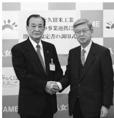
三田村市長と今泉久留米工業大学長が握手