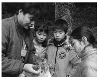
星野ネイチャーズウエイの活動はフェイスブックで見ることができます。https://www.facebook.com/HoshinoNaturesWay/

星野村は、山や川など様々なアクティビティ(活動)を行うポイントが小さいエリアでまとまっていて自然体験プログラムを行うのに非常に適した地域です。豊かな自然の