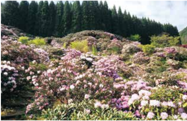
山二面に咲き誇る ミヤシノシャクナゲまつり

八女市公式 HP http://www.city.yame.fukuoka.jp/ E-mail mail@city.yame.fukuoka.jp