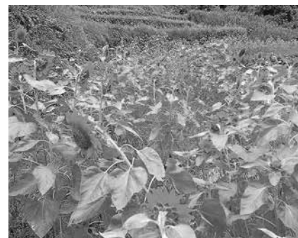
広内・上原の棚田に咲き誇るひまわり

で多くの方々に来ていただいて、遠くは福島県郡山市からも参加がありました。またIVUSA (NPO法人国際ボランティア学生協会) とも連携して、広内・上原の棚田の復旧活動を行うなど、幅広い世代の方たちから支援を受けながら、今も活動を続けています。