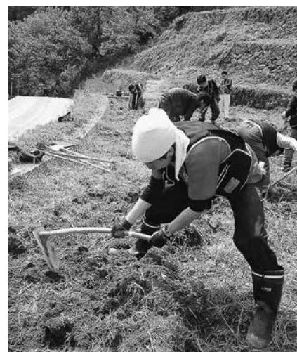
棚田を耕す大学生ボランティア