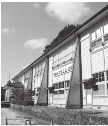
村人の心のふるさと矢部中旧校舎

旧八女市は、昭和26(1951)年福島町と長峰・三河・上妻・八幡村が合併し新「福島町」ができ、同29(1954)年には川崎・忠見・岡山の