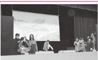
本番に向けての練習風景。旭座人形芝居（福岡県指定無形民俗文化財・黒木町笠原）は毎年11月3日に旭座人形芝居会館で公演。笠原小学校の伝統を受け継ぎ黒木小学校では、人形浄瑠璃クラブが活動しています。

当日は大勢の方に見に来ていただき、無我夢中で演じました。旭座人形芝居は市内でもまだご存じない方もいるようなので、多くの方に知っていただけて良かったです。合併して旧市町村の垣根もなくなりしました。市民みんなで八女の伝統芸能を守り育てていけるような環境を整えたいと思います。私たちもせっかく機会をいただいたので、旭座人形芝居のお手伝いできればと思います」