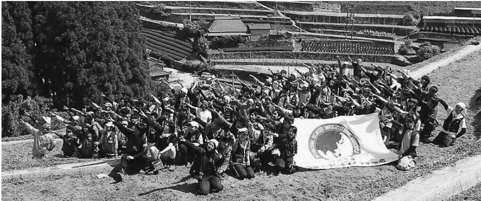
IVUSA 大学生ボランティアのみなさんと一緒に

「八女市星野村支援サイト」を開設して、災害の状況やボランティア活動の様子を発信し始めました。