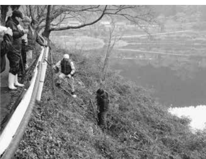
小雪の混じる寒い中作業しました

今年度も「地域づくり提案事業」を活用し、矢部地域ボランティア団体「昇盛会」を中心に1月31日(土)、約40人のボランティアが集合し、100本のモミジを植栽しました。また、河川浄化の推進を図るため、矢部川内の葦の枯れ草を処理しました。今後もたくさんの人々に、矢部地域のさまざまな観光資源を訪ねていただけるよう活動を継続していきます。