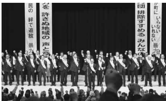
会場が一体となり暴力追放を決意しました

当日は約1000人の参加者が集まり、会議は盛況のうちに幕を閉じました。筑後地区全域の警察、行政、事業者そして住民が一体となって暴力追放・暴力団排除に向け一致団結しました。これからも安全で安心して暮らせる八女市を目指していきましょう。