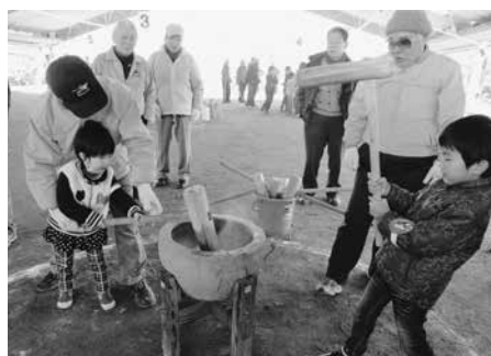
もちをつく参加者

第11回もちつきと豆まき会が2月1日(日)に、多世代交流館「共生の森」で行われました。当日は晴天にも恵まれ、約600人の参加がありました。