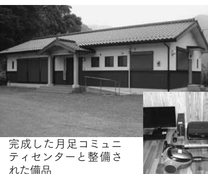
完成した月足コミュニティセンターと整備された備品