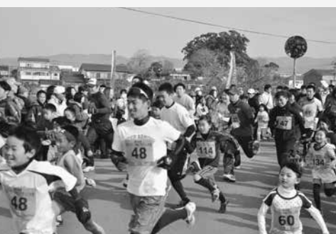
沿道の応援を受け走る選手の皆さん