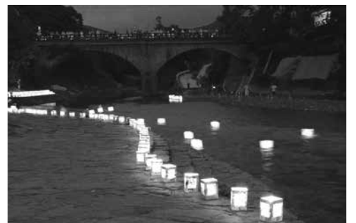
寄口橋から多くの人が眺めていました

九州北部豪雨の影響で昨年、一昨年と実施できませんでした。3年ぶりに復活。心待ちにしていた地域の人たちが見守る中、一斉に約300個の灯籠が星野川に流されると、辺り一帯は幻想的な景色が浮かび上がりました。