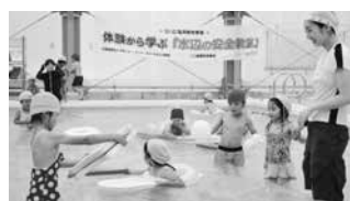
星野B&G海洋センター(池の山プール)ご利用ありがとうございました

市の下水道事業は、平成10年度に事業着手し整備を進めています。現在の整備予定区域内の整備が、近年においてほぼ完了する見込みとなっていることから、八女都市計画下水道の整備予定区域の拡張を行う予定です。 ▽事前縦覧 ●日時 9月16日(火)～9月29日