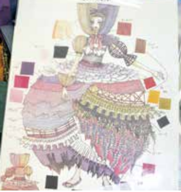
一次通過したデザイン画