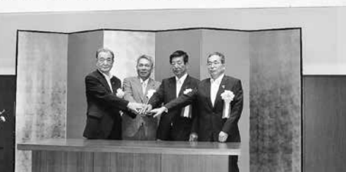
がっちりと手を取りあう各改良区理事長と立会人