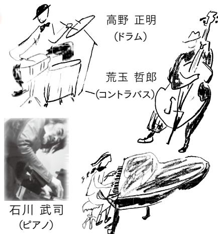
高野 正明 (ドラム)