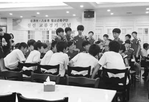
ジェスチャーや表情で心を通わす

親善試合では八女市チームは残念ながら負けてしまいましたが、天然芝のグラウンドでのびのびとプレーをしました。また、試合後に巨済市主催の交流会が開かれ、言葉はあまり通じませんでしたが子どもたちはジェスチャーや表情で心を通わせていました。この報告会は9月25日(休)市役所で行われます。