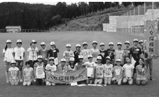
参加した市内の小学6年生の皆さん

の駅たちばな、茶の文化館、平和の塔、上陽町の石橋群を見学。平和の塔では、八女和紙で折った折り鶴と平和に対する思いを込めたメッセージボード作成して献呈しました。2日目は柚のふるさと文化館、グリーンフィールド八女などを巡り、柚のふるさと文化館では世界子ども愛樹祭コンクールに応募する木はがきを作りました。3日目は台風の影響で17日(日)に延期し、男ノ子焼きの里で焼き物を体験しオリジナルのマイカップを作りました。3日間をとおして、学校の垣根を越えて、新しいなかまと郷土八女のよさを再発見できました。