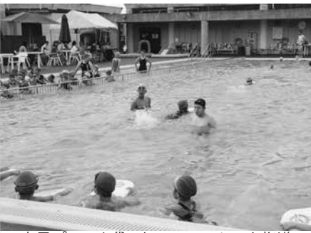
市民プールを貸し切っていていねいな指導

教室は、子どもたちの泳ぎのレベルに応じて4グループに分かれました。バタ足やビート版を使った練習などブリヂストンスイミングスクールのインストラクターや八女消防署員などから指導を受けました。教室最終日には、子ども一人ひとりに修了書が渡されました。