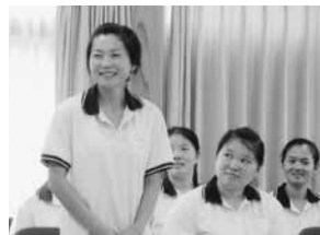
られ加(中)で図自研 かふ参(り)を 国とンんぶ流(下)る 中修生口さ手交(す)を の研サ皆りにした介を皆 のあいのぶいま紹介の修 の者身互り己修

修生も地元のふれあいサロン参加者の皆さんも大変喜んでいました。研修生の1人は「日本はとてもきれい。ご飯も緑茶もおいしい。日本大好きです」と喜んでいました。