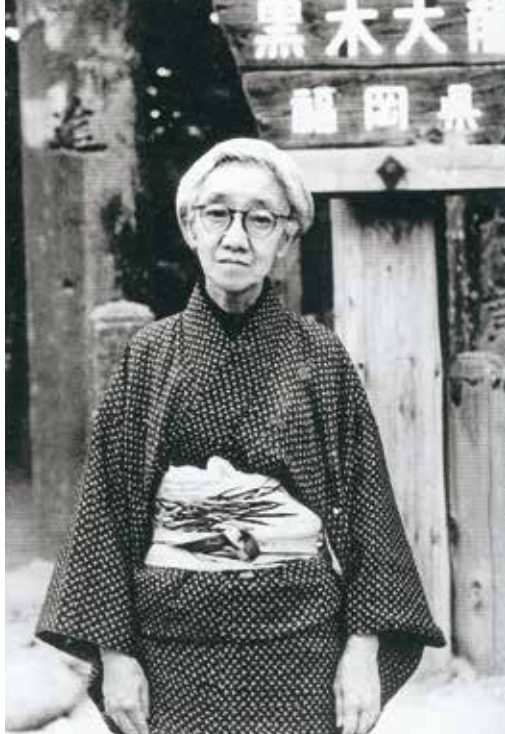
【柳原白蓮（1885～1967）】 歌人。伯爵家に生まれ、九州の炭鉱王・伊藤伝右衛門と再婚するが馴染めず、公開絶縁状を突きつけ7歳年下の大学生宮崎龍介と駆け落ちした。愛息が戦死し、戦後は平和活動家として全国を行脚。

【剣が淵物語】 800年近く昔の話、黒木町猫尾城主・源助能は妻の春日局を残し3年間京都で勤務をする。横笛の名手である助能は笛の音の褒美に帝より女官「侍宵小侍従」を妻にもらう。侍宵小侍従は徳大寺実定の子を身ごもっており、男子が生まれた。助能は侍宵小侍従と子を伴って帰郷。春日局はそのことを嘆き、乳母たちとともに矢部川に身を投げる。その後天地異変が続き、春日の幽霊まで出ると噂が広まった。自らの愚かさを反省した助能は、実定からもらった宝刀を矢部川の淵に投じた。平和な黒木の里に戻り、それ以来宝刀を投げた場所を「剣が淵」と呼ぶようになった。