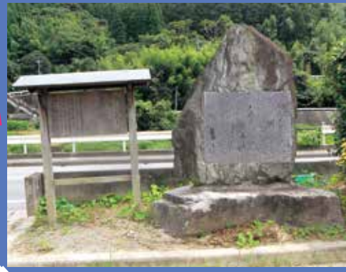
国道 442 号線沿いの小さな公園に立てられた碑。間もなく移転される