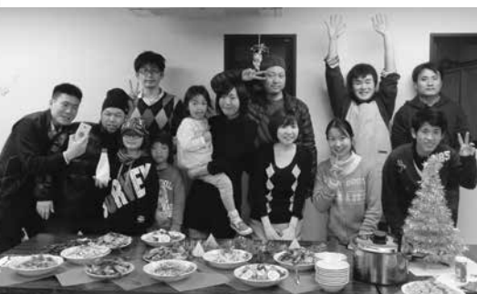
料理作りなどで交流を深め合った参加者の皆さん

参加者は、自分たちで作ったクリスマス料理を食べながら、ゲームをしたり、みんなで作ったクリスマスプレゼントを交換したり、楽しいクリスマスの一ときを過ごしました。企画した青年サークルのメンバーは「みんなでクリスマス料理を作りながら、同世代との交流を深めることは楽しい。来年もぜひ開催したい」と話していました。