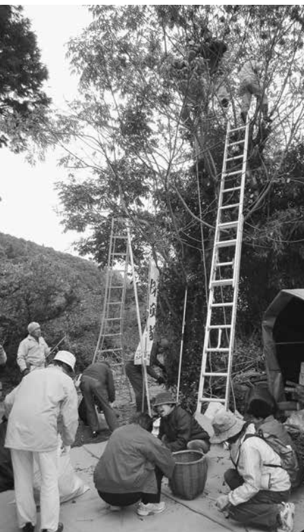
参加者でハゼの実をちぎり、ろうそくを作りました

この事業は全国モーターボート競走施行者協議会からの拠出金を活用した「環境保全促進助成事業」として実施しました。