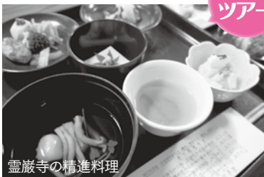
霊巖寺の精進料理