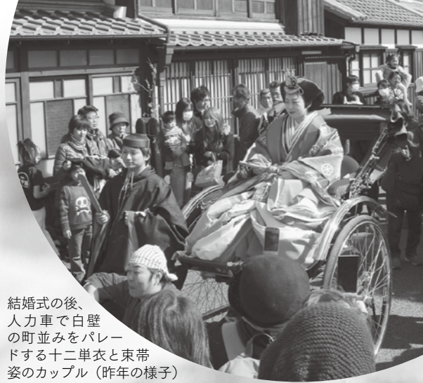
結婚式の後、人力車で白壁の町並みをパレードする十二単衣と束帯姿のカップル（昨年の様子）