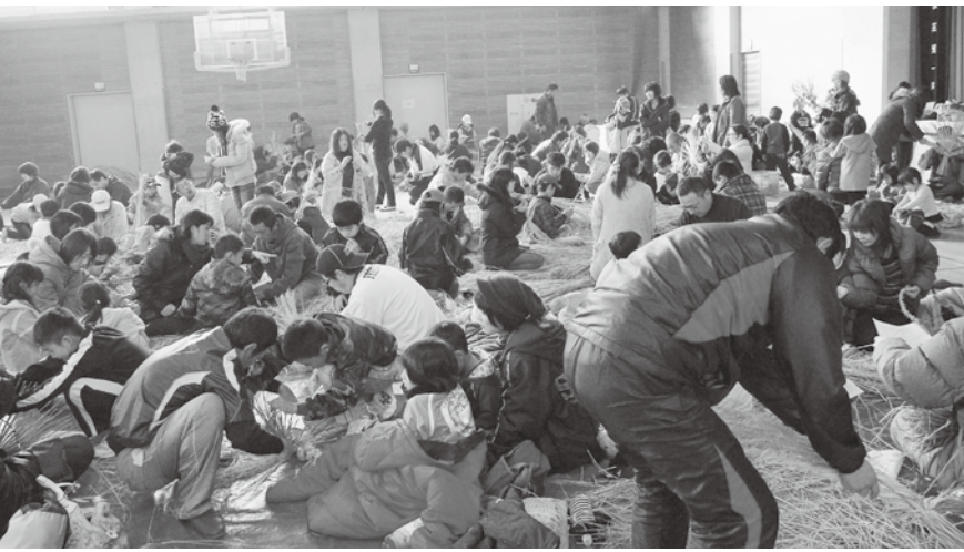
注連縄づくり会場の様子