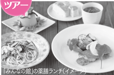
「みんなの館」の菜膳ランチ(イメージ)