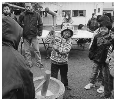
もちをつく参加者

アンビシャス広場や女性連絡会の協力もあり、つきたてのモチはきな粉、あんこ、ぜんざい、大根おろし等盛りだくさんのメニューでおいしくい