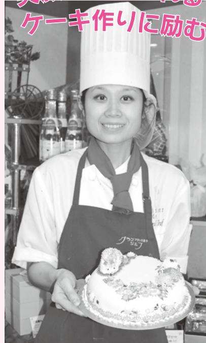
「忙しい毎日ですが、食べる人の笑顔を思い浮かべながら一つ一つ丁寧に作っています。一人で何でもできるようになるために頑張ります」