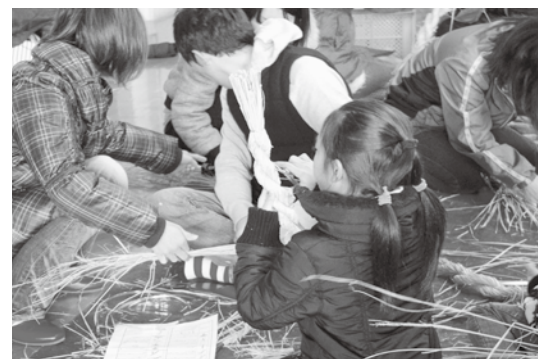
はみ出たわらを切り落とし、形を整えます

て、そこに別のわらを差し込むところが難しかった。注連縄を見たのも作ったのも今日が初めてだったので、楽しかった。(3年生男子) ◆家族で協力してできたのでよかったです。いつもと変わらない出来栄えだったけど、いつもよりもスムーズに作れました。(6年生女子) ◆家族でこうしてひとつの事を協力してすることで、親子のふれあいになつてよかったです。大人二人がかりでも難しいところを、子どもと一緒に協力して作れたので、いい注連縄が作れたと思います。(保護者) ◆普段は家族で何かひとつのものを作るということはなかなかないので、大変ではありますが毎年楽しんで参加しています。この注連縄づくりは家族の協力はもちろんのこと、地域の協力がないとできません。今年の注連縄づくりを通して、地域とのつながりもより一層深まったように思います。(保護者)