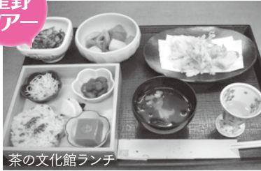
茶の文化館ランチ