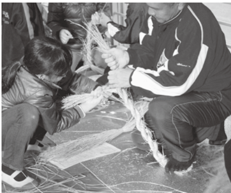
家族で力を合わせて

て、そこに別のわらを差し込むところが難しかった。注連縄を見たのも作ったのも今日が初めてだったので、楽しかった。(3年生男子) ◆家族で協力してできたのでよかったです。いつもと変わらない出来栄えだったけど、いつもよりもスムーズに作れました。(6年生女子) ◆家族でこうしてひとつの事を協力してすることで、親子のふれあいになつてよかったです。大人二人がかりでも難しいところを、子どもと一緒に協力して作れたので、いい注連縄が作れたと思います。(保護者) ◆普段は家族で何かひとつのものを作るということはなかなかないので、大変ではありますが毎年楽しんで参加しています。この注連縄づくりは家族の協力はもちろんのこと、地域の協力がないとできません。今年の注連縄づくりを通して、地域とのつながりもより一層深まったように思います。(保護者)