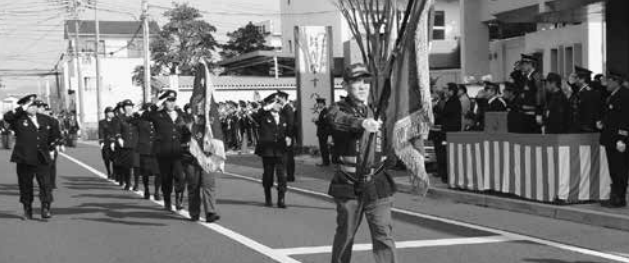
(上) 八女消防本部、八女市消防団、八女市立花消防団による市中パレードの様子 (右) 八女市矢部消防団と八女市星野消防団が小型ポンプ操法を披露しました