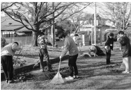
公園内の落ち葉を掃き集める清掃活動参加者

上陽町の「蓮の実団地」利用者と職員が12月7日(土)、北川内公園と清水町公園の清掃活動を行いました。清掃活動を希望した19人と職員4人が参加。今年初めて清掃作業に参加した5人も一所懸命に作業をし、ゴミ袋25袋分相当のゴミを集めることができました。皆さんお疲れさまでした。