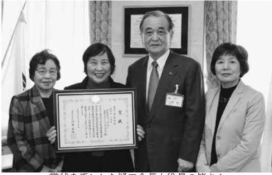
賞状を手にした樋口会長と役員の方々