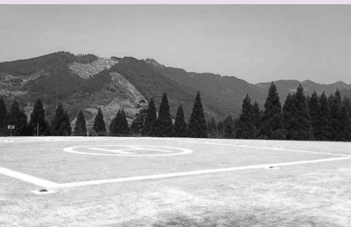
星野村平和の広場に整備されたドクターヘリポート