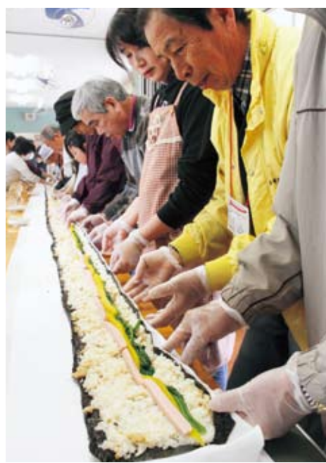
具材を中心にして息を合わせて巻いていきます

NPO法人迎春地域振興会議主催による竹林オーナー交流会が3月24日(日)、立花の迎春ふれあいセンターで行われました。オーナーやその家族、地元の竹林所有者など約50人が参加。これは、タケノコでつながったオーナーとの縁を大切に懇親を深めようと、収穫のはじまるこの時期に開催されています。