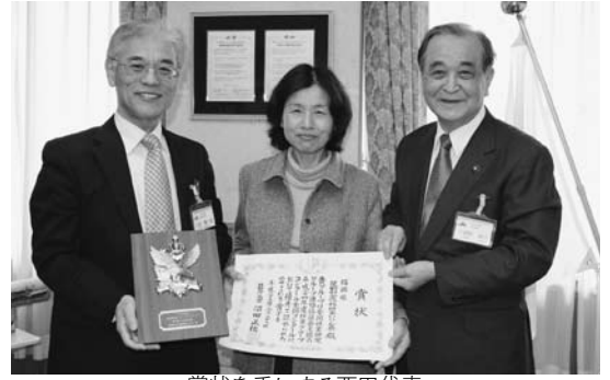
賞状を手にする西田代表