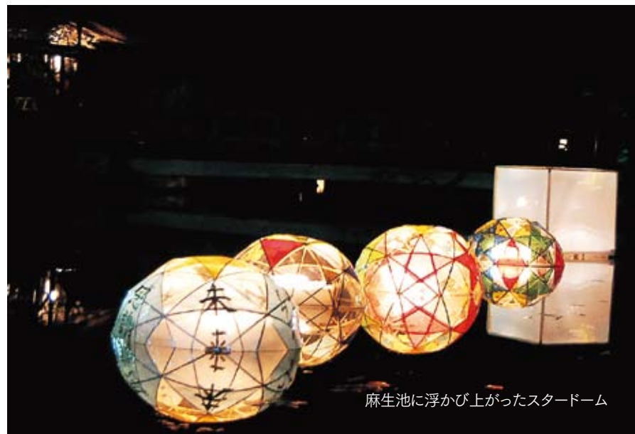
麻生池に浮かび上がったスタードーム

だ半球形の色とりどりの「スタードーム」も浮かべられ、水面に映り浮かび上がる球体の美しい眺めに、訪れた多くの来場者からため息がもれていました。そのほかにも乗馬体験や和太鼓演奏、マジックショーなども行われ、地元住民のほか復旧作業に参加したボランティアなど多くの人でにぎわいました。訪れた人々に「星野村は元気です」というメッセージを伝えていました。