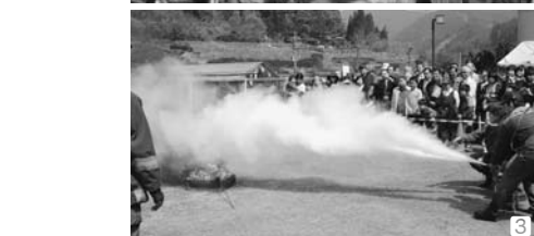
①煙ハウスでは煙にまかれ視界が遮られた時の怖さを体験 ②県警音楽隊とカラーガードによる演奏と演技 ③住民による消火体験