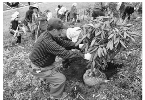
シャクナゲを植えるボランティアの皆さん

八 女市矢部村高巣公園および星野村平和の広場に、救急医療体制の充実を図るためのドクターヘリポートが3月に完成しました。へき地においては、道路も狭く、最寄りの病院まで1時間以上かかるため、できるだけ早く治療を開始することが重要です。ドクターヘリポートの完成により、今後、治療開始までの時間短縮が図られることが期待されます。