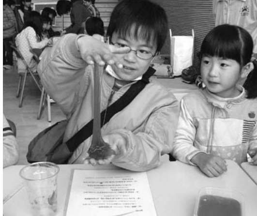
ネバネバ、ドロドロ、不思議な感触