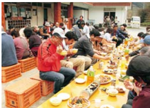
旬の野菜の天ぷらや山菜の煮物などの料理がずらり

竹林管理講習や同会議加工部による料理教室のほか、今年参加者全員でロング巻きずしを作りました。その後、採りたてのタケノコや地元旬の野菜を使った料理を囲んで懇親会が行われました。参加した一人は「迎春のタケノコはくせがなくておいしいですね。あたたかく受け入れてもらい、料理も分かりやすく教えてもらいました。来年もぜひ参加したい」と話し料理をおいしそうに食べていました。