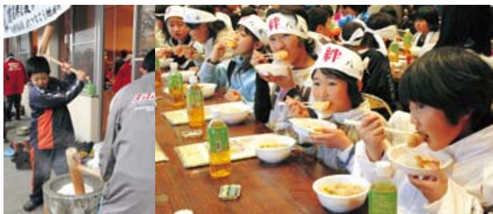
元気にもちをつき、もちをほおぼる子どもたち

12月27日(木)、八女伝統工芸館の中にある日本一大きな大神壇のすす払いが行われました。仏壇は高さ6.5メートル、幅3.8メートル、奥行2.5メートル。八女福島仏壇仏具協同組合の青年部9人が、長い竹ざおにくくりつけた毛ばたきでほこりををいていねいに落とし、はがれた金箔を補修したりしました。青年部会長の木佐木秀