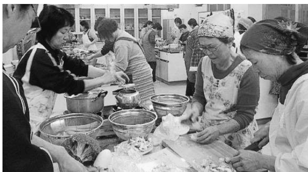
旬の食材を使い、手早く調理しました

NP O法人栄養ケア・ちっごでは、1月15日おこなう八女、2月19日かがやきで18時30分から「病気や体調に応じた食事の工夫」の教室を開催します。介護の仕事や家族のために多くの参加をお待ちしています。