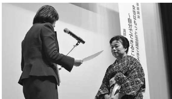
海老井副知事から賞状と記念品が贈られました

業委員会会長として先駆的に活動されていることから「女性の先駆的活動部門」で受賞。農業に従事しながら、大型機械免許の取得をきっかけに、自分の経験や学んだことを次に続く女性に還元しようと「トラクター講習会」や「じゃがいもづくり講習会」などを率先して開催しています。また、平成18年からさまざまな役職に就任するなど積極的に活動を続けられています。おめでとございます。