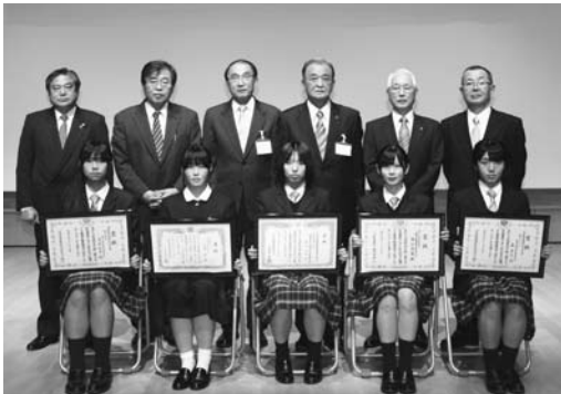
(上) 税に関する「作文」の中学生の入賞者の皆さん (下) 税に関する「作文」の高校生の入賞者の皆さん