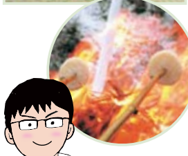
観光振興課 やまぐち