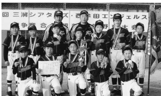
優勝した木屋フェニックスの選手の皆さん

ることによって心豊かにすることを目的として活動しています。お茶室体験、和菓子作り体験をした児童らは、「今年の災害でどうなるかと思っていました。大自然の恐ろしさとお茶の恵みを知りました。和菓子作りはとても楽しかった」などと話し、久しぶりのクラブ活動に感動の笑顔があらわれていました。