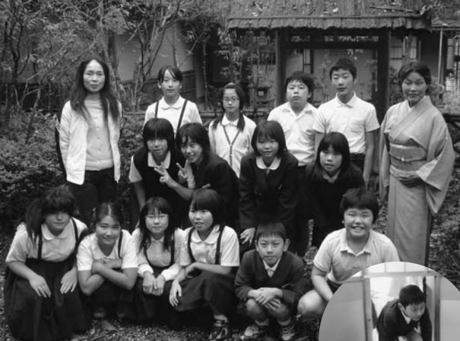
(上)お茶クラブの部員の皆さん(右)茶室の正式な出入口口である欄り口から出入りします