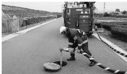
消火栓を使った消火活動の様子

皆さんのために使用する消防水利です。「ちょっとだけなら…」と駐車して、もしもの時に使えなければ意味がありません。一刻を争う消防活動のため、水利やその標識付近5メートル以内には駐車をしないでください。