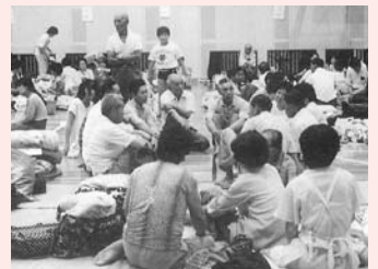
松尾地区の住民は上辺春小学校の体育館に避難しました