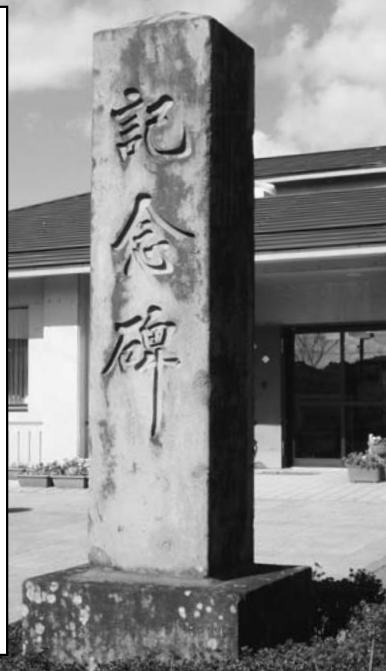
隣保館前の記念碑

大正拾年六月十七日八女地方ニ未曾有ノ大洪水アリ矢部川氾濫シ同日午前十一時突如相馬堤防破壊シ奔流襲来見ル間ニ中島川ニ面シタル家屋軒ヲ並ベテ流出セシモ八戸其他全家屋浸水六七尺家財家具ハ流失又ハ破損シテ矢部中島ノ両橋モ相前後シテ押流サレ為ニ区民ハ避難ノ道ヲ断レテ戦慄号泣生キタル心地モナカリシニ午後四時ニ至リ消防組ノ決死的奮闘ノ救護舟ニヨリ光友小学校ニ避難收容サレタリ此ノ大洪水ノ報伝ハルヤ全国民ノ熱誠ナル同情ニヨリ莫大ナル義捐金品ノ惠贈ヲ受ケテ当区ハ復興スルコトヲ得タリ特ニ畏レ多クモ事天聴ニ達シ御下賜金ノ光栄ニ浴シタル等永久ニ忘ルル得ハザルコトナレバ記シテ後世ニ伝フ