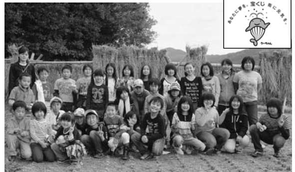
稲刈り体験に参加した子どもたち