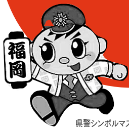
県警シンボルマスコット「ふっけい君」