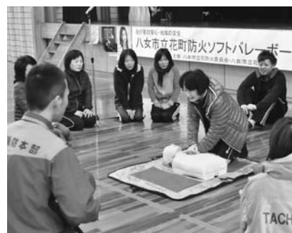
AEDを使った心肺蘇生法の研修も行われました

安全」を目的に、主婦層への防火意識の啓発と体育館等公共施設の利用者にAED(自動体外式除細動器)の使い方を学んでもらおうと、防火防災研修とソフトバレーボール大会を合わせて行われています。4回目の今年は、研修以外に7月に発生した九州北部豪雨災害の写真展示や消防署等の関係機関が撮影した空撮ビデオ上映なども行われました。参加者は試合で親睦を深めるとともに、研修をはじめ試合の合間には写真やビデオ