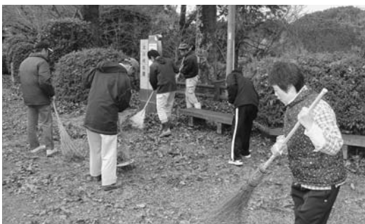
落ち葉がぬれて作業しにくいなか作業しました

今年も、日ごろお世話になっている地元の人々への感謝の気持ちを含めて、清水町商店街駐車場と北川内公園、清水町公園の市内3か所に分かれて希望した入所者15人が清掃作業をしました。北川内公園では、例年より落ち葉が多く、前日の雨により落ち葉がぬれて作業しにくい状況でしたが、同日に作業を行った「蓮の実園」の利用者らと協力して作業を行い、きれいになりました。皆さんお疲れさまでした。