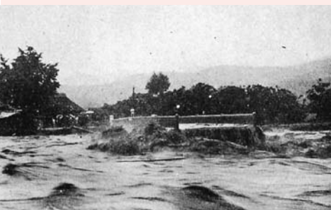
流失した国道矢部川橋のあと