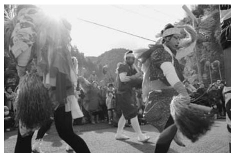
太鼓や笛の音に合わせて風流を舞う

県の無形民俗文化財の指定を受けている「田代の風流」が12月8日(土)、黒木町田代地区で行われました。大名行列の出発を前に華やかな風流が披露された後、おしるいを塗って扮装した奴姿の男衆たちが沿道を練り歩きました。道中、鮮やかな傘さばきやはさみ持ちが道中文字句を披露すると沿道からは歓声が上がっていました。