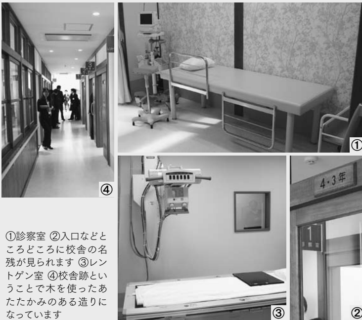
①診察室 ②入口などところどころに校舎の名残が見られます ③レントゲン室 ④校舎跡ということで木を使ったあたたかみのある造りになっています

診療所も予防医療に力を入れた診療に取り組みれる予 定で、地域に根ざした診療活動が期待されます。