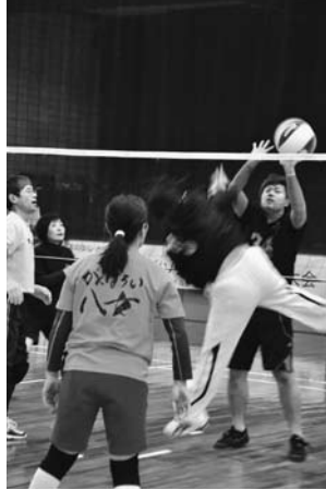
親睦が深まったソフトバレーボール

「八女市立花町防火ソフトバレーボール大会」が12月2日(日)立花体育館で開催され、12チーム約90人が参加しました。