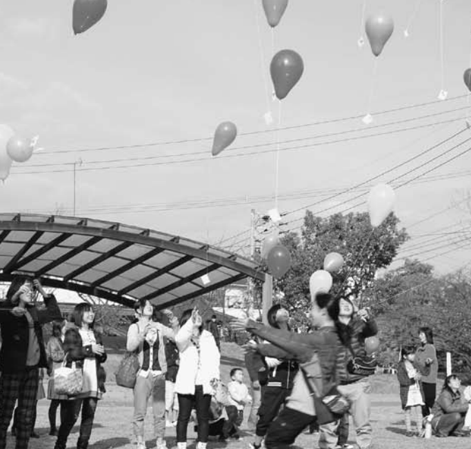
人権の花の種を付けた風船が大空に飛び立ちました

上の妹は下の妹のお世話を本当によくします。また、しょうがいのある妹も笑顔やかわいいひざ立ちをして家族みんなをいやしてくれます。それに毎日の学校での生活やリハビリもがんばっています。私も父や母が助かるようなことをたくさんして、感謝される家族の一員に早くなりたいと思います。そして将来の仕事として、しょうがいを抱った人々の役に立つ夢も、時々考えるようになってきました。