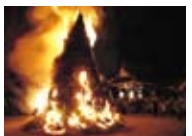
柳島の十七夜(あめがたまつり)