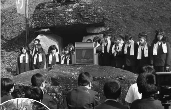
(上)古墳前で紙芝居を披露 (左)代表児童2人で火をつけました