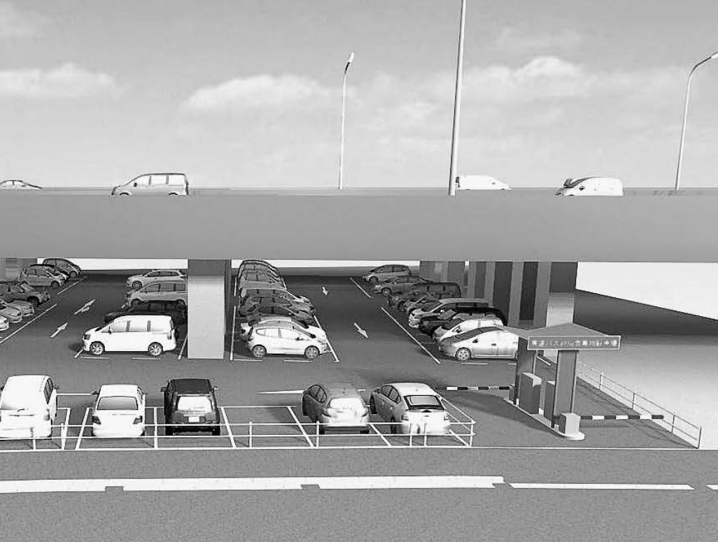
駐車場の完成予想図（九州自動車道八女インターバス停付近）