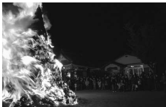
勢いよく燃え上がる炎に無病息災を願いました