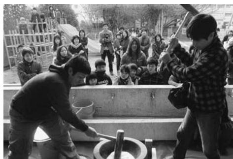
お父さんたちの力強いもちつき