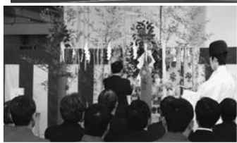
(上) 完成したタキロンポリマー株式会社新社屋 (左) 神事の様子