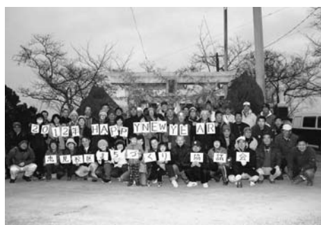
八女中央大茶園の五社神前で記念撮影

忠見校区まちづくり協議会は1月1日(祝)、「初日の出を観よう」ウォーキングを開催しました。