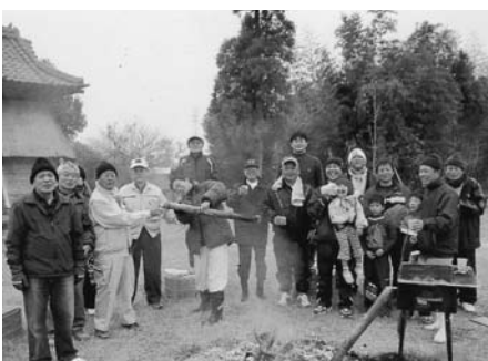
参加者全員で健康と繁栄を祈願しました

平田行政区内の消防団と平田球友会主催による約40年続く初日の出見を1月1日(祝)、平田天満宮境内で行いました。行政区長、公民館長や地域の人たちなど約40人が参加しました。山にたきものを取りに行き、お神酒をつける孟宗竹を4本準備し、元日は6時に集合。火をたき、お神酒を飲みながら初日の出を待ち、今年一年の皆さんの健康とご繁栄を祈念します。今年に残念ながら曇天で日の出を拝むことはできませんでしたが、長老二人が東に回り帽子を脱がれたので、太陽に負けない光沢を見ることができました。行政区長の万歳三唱の音頭で3時間の祝宴は終了しました。(平田・毛利久)