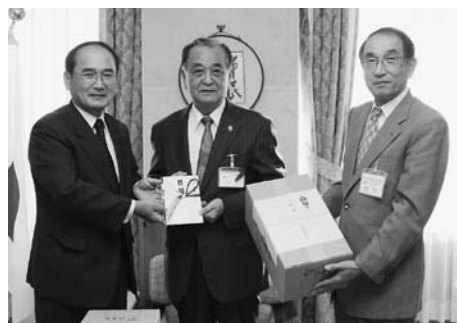
古川副会長（左）から贈られました

私たちが普段飲んでいるお茶には抗菌、抗ウイルス作用などがあるといわれています。今回市内の28の小中学校へ贈られたうがい用の八女茶ティバッグは9200個（1袋20グラム）。各校では11月から来年2月までの間、八女茶によるうがい風邪予防に取り組んでいきます。