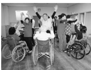
誰もが気軽に楽しめる車いすレクダンスの活動風景

※ふくし邑では活動に関わってくれるボランティアを募集中。 八女市稲富1-1-1(福島保育所裏) ☎24・2448