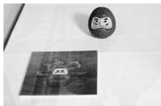
絵のモチーフになっただるま