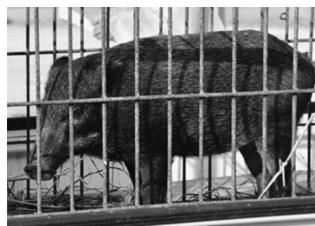
捕獲されたイノシシ

八女市ではイノシシ以外にも、アナグマ・アライグマやカラス・ヒヨドリなどの被害もあ