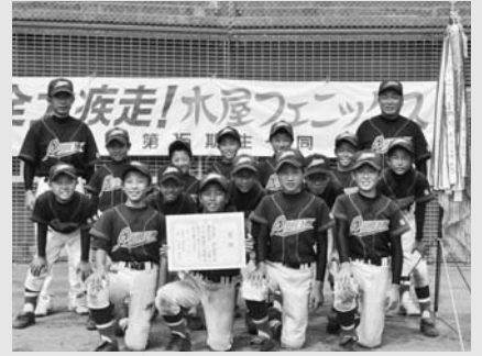
小学生の部で優勝した木屋フェニックス