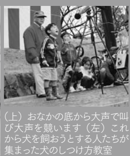
(上) おなかの底から大声で叫び大声を競います(左) これから犬を飼おうとする人たちが集まった犬のしつけ方教室

環境フェア in 八女が10月30日(日)、八女公園を会場に行われました。朝から激しい雨が降る天気でしたが、「みんなで楽しくリサイクル」をテーマに廃油せつけん・エコバッグの配布や生ゴミ処理機の展示ステージでは環境ごみ出しクイズや大声大会などさまざまなイベントが行われました。多くの人が、楽しく遊びながら環境について学びました。