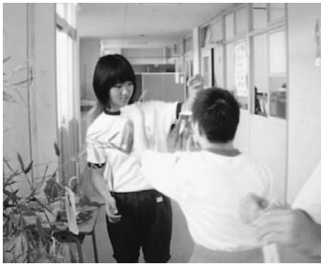
校内オリエンテーリングで探し当てた「七夕飾り」を一緒につけました