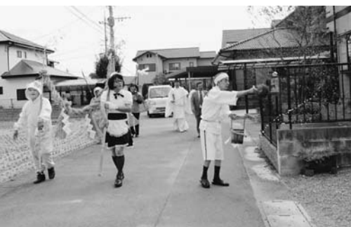
おはらいをしながらにぎやかに練り歩きました

花宗神社は明治45年に上津江(素盞鳴神社、天満神社、阿波島神社)、下津江(熊野神社)、後ノ江(若宮神社)が合祀されたもので、今年で合祀100周年となります。7月15・16日には3行政区で合同の百周年記念行事が行われました。