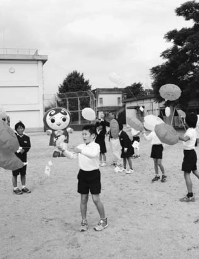
風が強くあっという間にエコ風船は空へ舞いあがりました

「ひまわりの種を拾った人に大切に育ててほしい」「いろんな人にひまわりの種が届くといいな」など話していました。