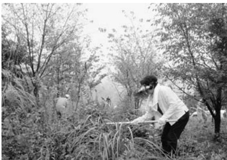
伸びきった草を刈り取る参加者

八女市矢部村高の集で10月23日(日)、「柳川市民の森」の下草刈りボランティアが行われました。平成17年に柳川市と八女市矢部村とは「水のふるさと協定」を結び、八女市高の集市有林を「柳川市民の森」に指定し、毎年柳川市民による下刈りボランティアを行っています。