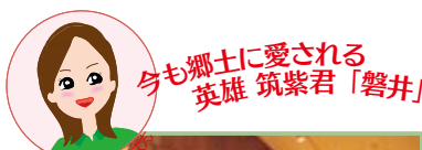
身も郷土に愛される英雄 筑紫君「磐井」