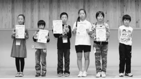
大会上位入賞者の皆さん