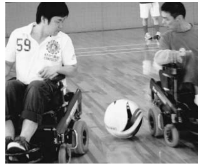
県内では一つしかない車いすサッカーチーム「アメリカンドリーム」を作って練習しています