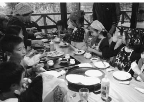
思い思いのトッピングで楽しみました

悪玉コレステロールを下げる働きをもつオレイン酸を多く含むひまわり油でホットケーキを焼き、思い思いにトッピングして食べました。皆さんそれぞれひまわりを育てた思い出話に花を咲かせ、にぎやかな交流会となりました。「上陽各地で幅広く活動し、素晴らしい取り組み