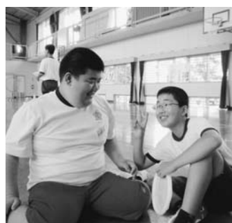
初めての出会い。レクリエーションの合間にちよつとひと休み。これからもよろしく

1回目るときよりも、相手のことを考えて行動したり、ペアの人と話をしたり、遊んだりして、友達への気持ちが変わりました。体の自由がきかない人に対しての接し方や心がまえ、そして気持ちも分かり、1回目の交流学習のときには恥ずかしくて伝えられないこともありましたが、積極的に話しかけること