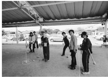
グラウンドゴルフを楽しんだ皆さん

教室には、初心者からベテランまで約40人が参加し、スコアの付け方などルールについて指導を受けました。ルールの厳しさに、初心者は緊張した面持ちでプレイ。しかし初めてのホールインワンに大喜びしたり、思うようにいかないボールに負け惜しみを言ったりして楽しんでいました。「次回はいつですか?」と尋ねる参加者もいて、同会代表の堤さんは、「皆と仲良く、自分