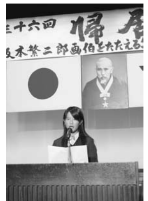
坂本画伯について発表