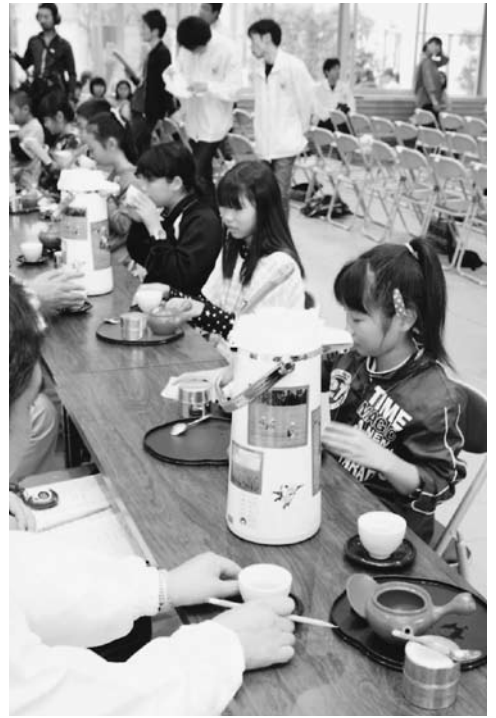
審査委員の目の前で、真剣な表情でお茶をいれる参加した子どもたち

T-1グランプリ福岡in八女が11月6日(日)、黒木町の地域交流センター「ふじの里」で行われました。これは日本の伝統的な茶の文化に親しみ、自分で茶をいれる習慣を身に付けてもらおうと福岡県茶業青年団が主催し今年で3回目。小学3年から6年までの126人が出場し、お茶のクイズやお茶