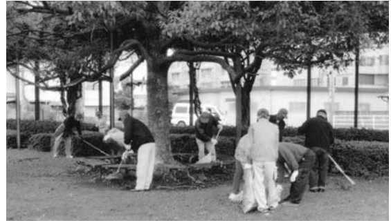
どの施設なども清掃で美しくなりました

シルバー人材センターでは、八女本所、黒木出張所、立花出張所管内の施設などの清掃作業を行いました。