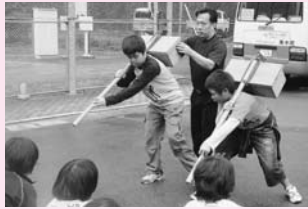
田代風流の体験の様子