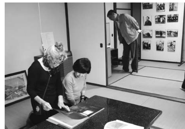
じっくりと写真を眺める見学者