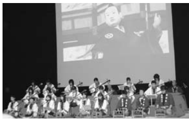
八女福島島の燈籠人形子ども教室

10月23日(日)「茶のくに・やめウオーキング大会」が行われ、参加者約300人が美しい日本の歩きたくなる道500選に選ばれた八女丘陵の古墳群を訪ねる道を歩きました。