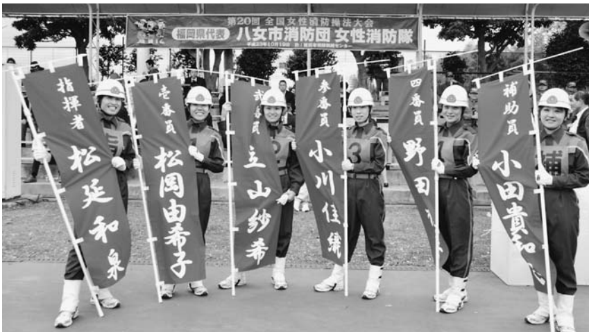
選手以外の女性消防隊手作りののぼりを手にする選手の皆さん