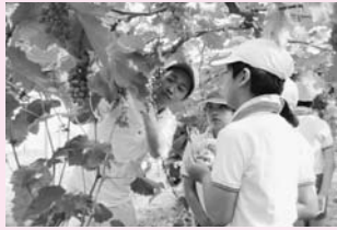
ブドウ摘み体験の様子