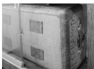
フランス留学中に使ったカバン