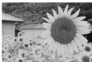
元気いっぱい咲いたひまわり

て積極的な参加の声が上がっていました。太陽のように明るく元氣いっぱい咲いたひまわりは9月に収穫。種を一粒、一粒とって乾燥、搾油したひまわり油が参加者に配られました。