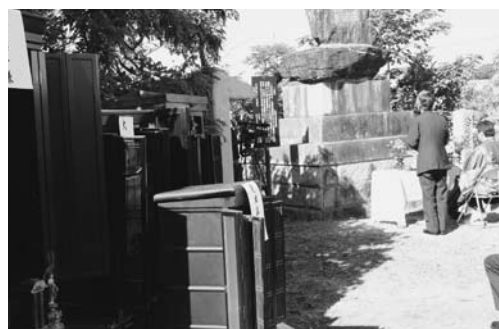
古くなった仏壇が並べられ供養が行われました

八女伝統工芸館仏壇記念碑前で10月27日(木)、仏壇供養祭が八女福島仏壇仏具協同組合の主催で行われました。これは毎年10月の仏壇の日にあたる27日に行われ、今回で19回目。今年も、県外なども含め10本の仏壇が持ち込まれました。関係者約40人が参列し、読経の中、一人ずつ焼香、礼拝をして処分される仏壇を供養しました。