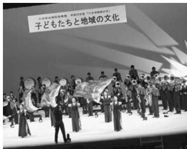
八女学院中学・高等学校吹奏楽部