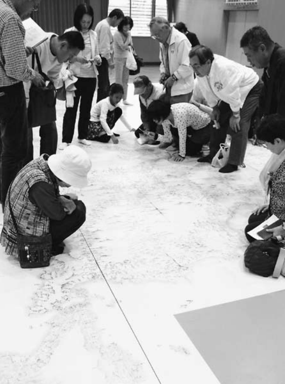
八女市合併記念事業