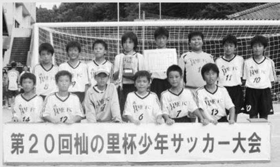
高学年の部で優勝した八女FC