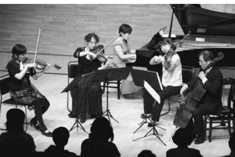
間近で奏でられる音色に聞き入っていました

アクロス・レインボーコンサートin八女が8月21日(日)、おりなす八女はちひめホールで行われました。会場は小さな子ども連れなど約240人でほぼ満員。皆さん間近で奏でられる生の演奏に耳をかたむけていました。