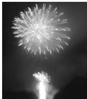
山あいに上がる花火

「矢部村花火大会」が8月15日(月)、矢部第1運動場で開催されました。 あいにくの雨で一日順延となりましたが、アフリカ太鼓の演奏やラムネ、ビールの早飲み大会、お楽しみ大抽選会などいろいろなイベントで、会場は大変盛り上がりしました。最後に、矢部村の山々にこだまする花火は迫力満点で、会場から大きな歓声があがっていました。