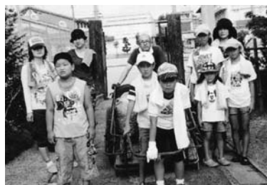
川掃除に参加した土橋子ども会の皆さん

土橋町内では、町内を流れる平塚川、土橋川、五丁野川の川掃除を行っています。平成11年から年3回、全世帯に呼びかけて毎回90人程度の参加者で実施してきました。 今年は7月10日(日)に川掃除を行いました。全世帯総出で川掃除をする大人たちの姿を見た土橋子ども会が、川掃除で出たごみの運搬作業の応援を申し出てくれました。