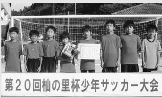
低学年の部で優勝した岡山少年サッカークラブ