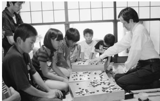
大淵九段(右)との三面打ちに挑む子どもたち

あすなる囲碁教室(本村)の子どもたちが8月12日(金)、プロ棋士の大淵盛人九段に囲碁の指導を受けました。同教室には15人の子どもたちが登録しており、土日の午前中に練習しています。 当日、子どもたちは大淵九段が一度に3人を相手する三面打ちで2回の指導を受けました。真剣な表情で碁盤に向かう子どもたちは「生きていない石が一つもない」「全然すぎがなかった」とプロのすごさに驚きと感銘を受けました。大淵九段は子どもたちに「囲碁は素晴らしい伝統文化なので、若い人たちがしっかりと将来に伝え、生涯の趣味として楽しんでほしい」と話しました。