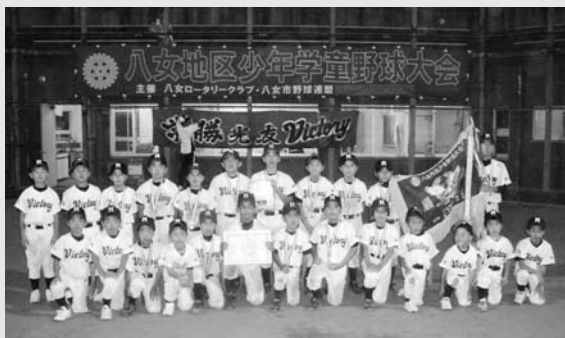
V2を果たした光友ヴィクトリーの選手