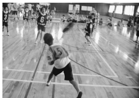
ディスクを相手めがけて投げます

八女市子ども会ドッチビー大会が8月7日(日)、総合体育館で行われました。ドッチビーは、柔らかい素材をつかったフライングディスク（フリスビー）を使ったドッチボール形式のニュースポーツです。市内の各校区、地区から13チームが出場。予選リーグ、決勝トーナメントと元気にプレーしました。4チームが争う決勝トーナメントでは、Sun・Go!チーム（三河校区）と川崎チーム（川崎校区）が決勝へ進み、熱戦を繰り広げた結果、Sun・Go!チームが優勝しました。