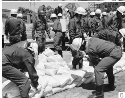
①地震発生との想定後に設置された災害対策本部 ②八女消防本部特別救助隊による埋没車両からの救出訓練 ③ヘリコプターによる孤立者の救出訓練 ④倒壊家屋などからの救助者を応急手当するDMAT（県災害派遣医療チーム） ⑤陸上自衛隊第4高射特科大隊や八女市消防団などによる水防訓練