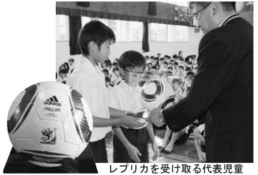
レブリカを受け取る代表児童