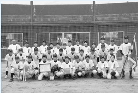
優勝した立花中学校