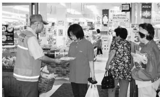
グッズを渡し買い物客に交通安全を呼びかけました

関係者は、黒木町の農産品を信号機の色に模した「青いピーマン」、黄色のミカン、赤いトマト」をパック詰めしたものと、シートベルトパットなどの運転補助グッズなどを来店者に配布し、飲酒運転追放と高齢者と子どもの交通事故防止を呼びかけました。