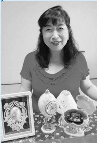
美しく装飾を施したダチョウの卵の中にお雛様を入れたり、生活の中で楽しめる作品を多く手がけています。