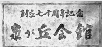
拓本 故・落合精一（栖閑）