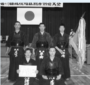
一般の部優勝の八女市剣友会A