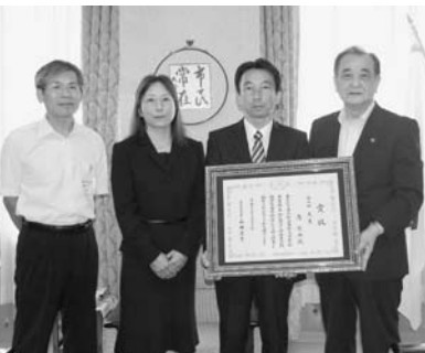
受賞した・さんご夫婦

・さんは平成9年から大豆を生産し、現在の作付面積は3・5ヘクタールで、排水対策と新技術の導入などで、安定多収を実現。昨年は豪雨などの被害で県内の大豆生産が大幅減収となるなか、県内平均の6割を上回る収量を確保しました。「日本の自給率を上げるためにこれからも頑張ってください」との市長の励ましに、・さんは「家族が力を合わせて頑張った結果なので大変うれい。安全な国産大豆を多くの人に食べていただきたい」と喜びを語りました。