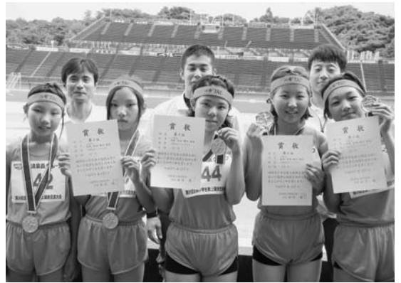
入賞したリレーの選手たち