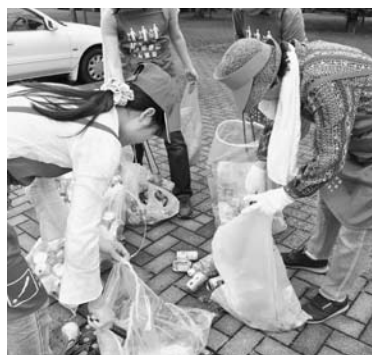
集めたごみを分別する皆さん

7月6日(火)、八女たばこ販売協同組合婦人部を中心とした会員17人が、立花支所周辺と千間