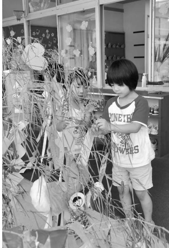
願いを書いた短冊を飾りました

光友保育所では、子どもたちが1週間ほど前から作った色とりどりの飾り物と、子どもと保護者が願い事を書いた短冊が飾り付けられました。短冊には「ピ