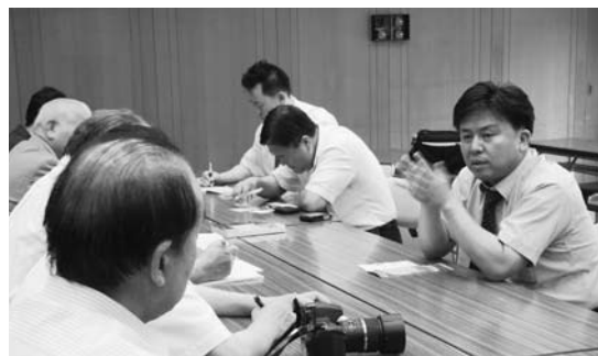
旅行業者と関係者との商談会の様子

韓国からの観光客誘致を図ろうと7月5日(月)、八女市商工会と市は共同で釜山の旅行業者3人を招待しての旅行商品開発のためのモニターツアーを行いました。