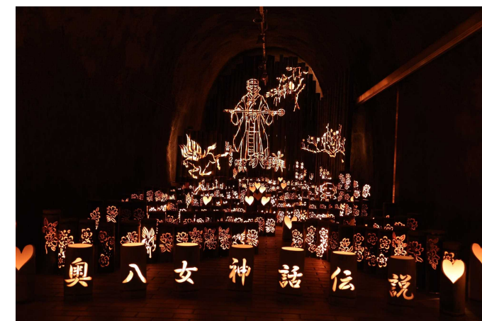
▲竹あかり光と幻想の世界