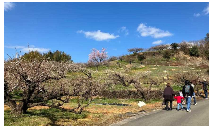
▲谷川梅林を開催期間中解放