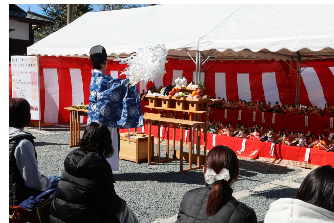
▲おひなさま供養祭