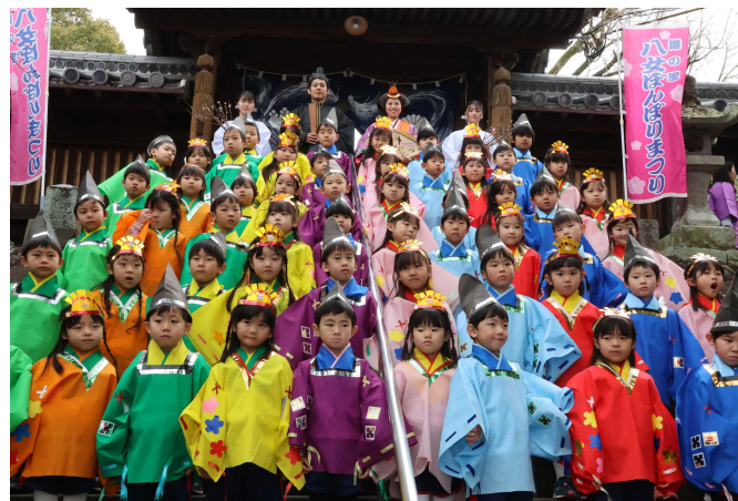
▲十二単衣と束帯姿の結婚式とフォトウエディング