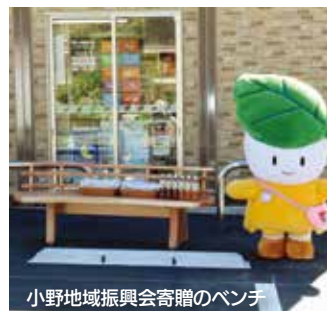
小野地域振興会寄贈のベンチ

今回のオープンをきっかけに買物支援をはじめとした中山間地域の課題解決に向け、地域はもちろん、官民一体となった取り組みを進めてまいります。