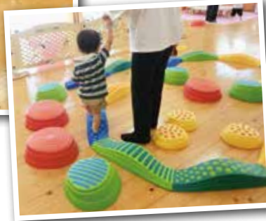
▲バランスストーンの日