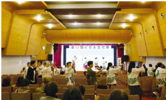
▲くろぎ文化祭 芸能大会の最後に、黒木町音頭を総踊り

11月2日(日)～5日(水)には黒木文化連盟主催のくろぎ文化祭、11月2日(日)～9日(日)には八女文化連盟主催の八女総合文化祭も開催され、芸術や芸能を通して生き生きと活動する皆さんの姿が見られました。