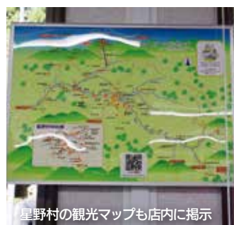
星野村の観光マップも店内に掲示