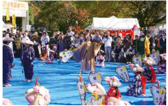
▲八女矢部まつり(矢部清流学園の浮立)