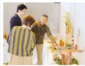
▲くろぎ文化祭「展示部発表」