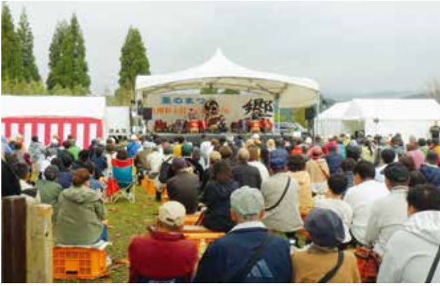
▲八女星のまつり(九州和太鼓フェスティバル)