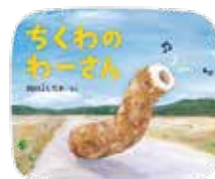
ちくわのわーさん/ブロンズ新社

『ちくわのわーさん』で第3回リプロ絵本大賞を受賞以降『特急おべんとう号』『おいしいものーさん』『オニのきもだめし』など数々の人気作品があります。おかしなキャラクターたちが繰り広げるナンセンスストーリー。この機会にぜひ読んでみてください。