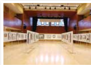
▲八女総合美術展「水墨展」