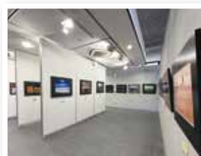
▲八女総合美術展「写真展」