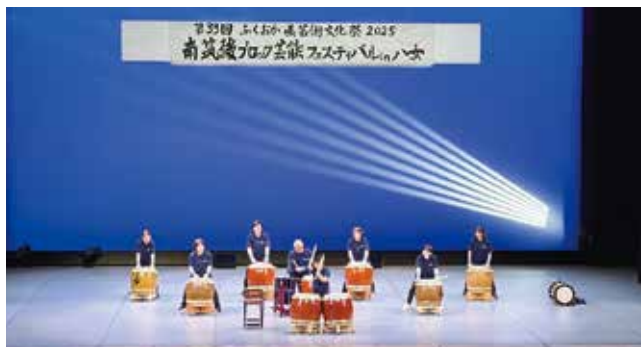
▲南筑後ブロック芸能フェスティバル