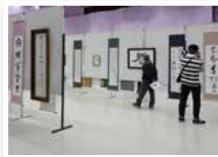
▲八女総合美術展「書道展」