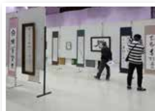
▲八女総合美術展「書道展」