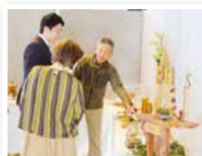
▲くろぎ文化祭「展示部発表」