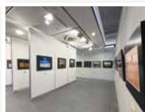
▲八女総合美術展「写真展」