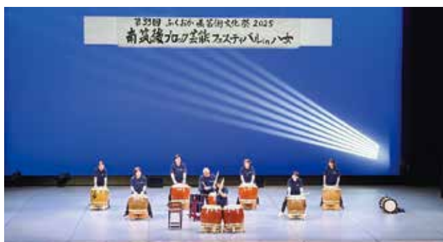
▲南筑後ブロック芸能フェスティバル