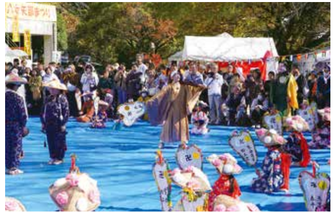
▲八女矢部まつり(矢部清流学園の浮立)