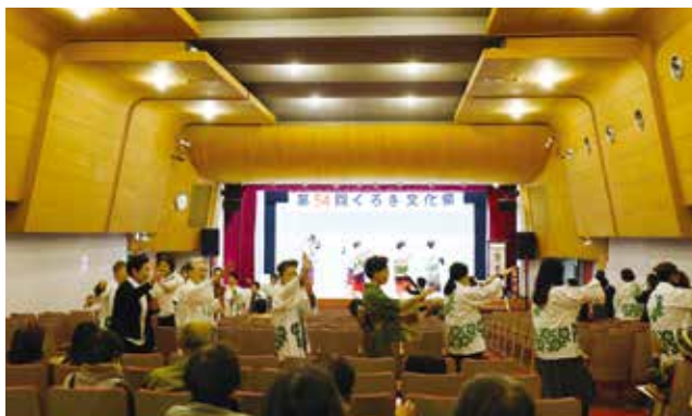
▲くろぎ文化祭 芸能大会の最後に、黒木町音頭を総踊り

11月2日(日)～5日(水)には黒木文化連盟主催のくろぎ文化祭、11月2日(日)～9日(日)には八女文化連盟主催の八女総合文化祭も開催され、芸術や芸能を通して生き生きと活動する皆さんの姿が見られました。