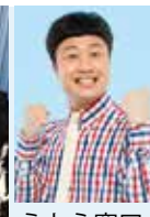
えとう 窓口 (Wエンジン)

(全席指定) S席 一般 5,500円 友の会 5,000円 A席 一般 5,000円