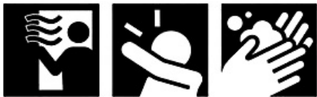
換気 咳エチケット 手洗い