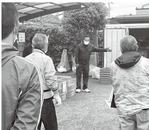
▲ごみの出し方の説明会

1972年に開催された「ストックホルム国連人間環境会議」を記念して、6月5日は「環境の日」に定められています。日本では6月を「環境月間」として、限りある資源や環境の保全に対して関心と理解を深めるための普及啓発活動を実施しています。