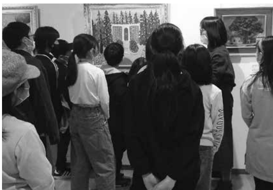
▲絵を観て意見を出し合う子どもたち

来場者の声 ●ハンセン病問題とは何か、何があったのか、私たちが犯してきたしまったことは何かを考える入口になった。もっと多くの人に見てもらいたい。もっと学びたいと思えると思う。(70代) ●人権がふみにじられていたこと。とてもおかしいことがまかりとおっていたこと。真実を知り、これからの自分の行動につなげていきたいと思いました。(50代) ●当事者に「差別はなくならない」と思わせてしまっている現実を、私や子どもたちから変えていきたいと思いました。(20代)