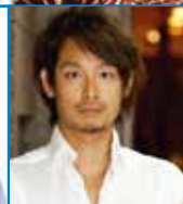
ジャズドラマー 榎 孝仁