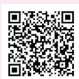
八女市のマイナポイント 手続きスポット