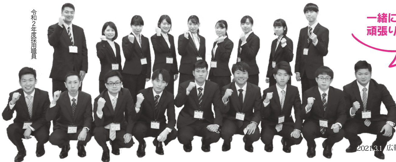
令和2年度採用職員