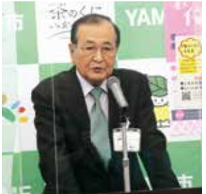
2月定例記者会見にて