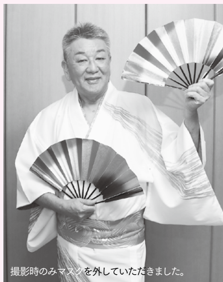
撮影時のみマスクを外していただきました。

新曲「茶の郷八女市スーパーONDO」、「八女茶でサンバ」はテンポが良く、歌って踊れる、楽しい曲です。ぜひ聴いてください。YouTubeでMVを公開中！ YouTubeはこちら→