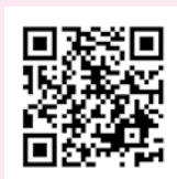
マイナポイント 予約・申込サイト

すでにマイナンバーカードをお持ちの人も、マイナポイントをもらうためには、予約と申し込みの手続きが必要になります。まだ予約や申し込みの手続きをしていない人は、スマートフォン専用のアプリ、もしくは、市役所や郵便局などのマイナポイント手続きスポットにて手続きをお願いします。