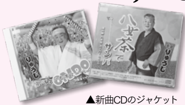
▲新曲CDのジャケット

「自分の歌を歌いたい」という気持ちが強くなり、平成29年62歳でソロデビューしました。リリースイベントとして九州を中心に43か所