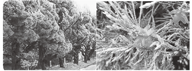
カイヅカイブキ(左)とカイヅカイブキに付着した赤星病菌(右)

【柳川きもの日和】 ●日時＝ 3/13(土)・14(日) 10:00～15:00 ●場所・問い合わせ＝柳川市観光案内所 (☎0944・74・0891) 【おひな様水上パレード】 ●日時＝ 3/21(日) 11:00～12:20 ※雨天時 3/28(日) ●出発＝沖端水天宮付近 ●問い合わせ＝柳川市観光案内所 (☎0944・74・0891)