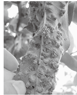
梨の葉に感染した赤星病